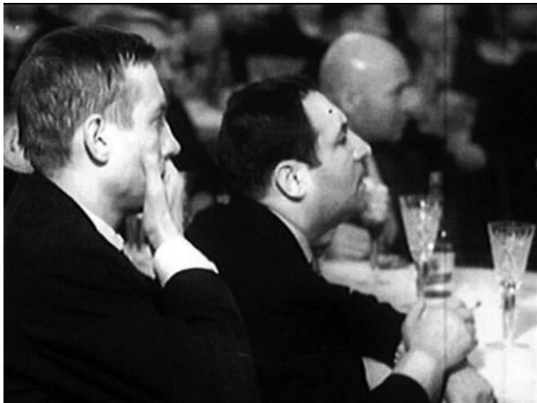
Евтушенко и Эрнст Неизвестный на правительственном приеме.

Вдруг ко мне подходит помощник Хрущева и говорит: «Евгений Александрович, вот там бумаги ваши задержали, в Германию вы должны ехать. Так вот, я сейчас Никите Сергеевичу доложил, сейчас хороший момент был». (Это был тот самый помощник, который когда-то ему подложил вовремя мое стихотворение «Наследники Сталина».) И он мне говорит: «К вам сейчас подойдет Никита Сергеевич, только вы, ради Бога, не скажите ему что-нибудь бестактное, вы опять на него не нападайте». Я говорю: «Так я ж не нападаю, я про-