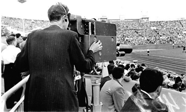
Ил. 1. Телевизионная трансляция с футбольного матча на стадионе «Динамо» (М. Озерский. 1955) – ГБУ «ЦГА Москвы», № 0-17464

Для того чтобы создать иллюзию спонтанности на экране, команда телевизионщиков, осуществлявшая прямую трансляцию с фестиваля, прошла тщательную подготовку по импровизационному выступлению на камеру 136 . Но когда экстремальные условия фестиваля быстро привели к сбою в графике трансляции, предусматривавшем тщательно выверенное время выхода в эфир из разных точек города, результатом стали подлинная спонтанность и живость репортажей.