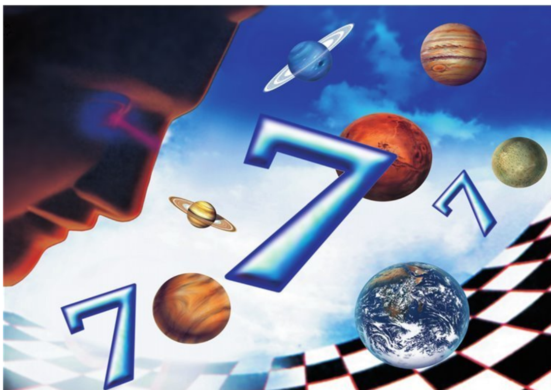
Чудеса начинаются с цифры семь

Почему только семь? Неужели древность была так бедна на чудеса? Нет, конечно. Просто число семь само по себе чудесное, волшебное, вот и решили на нем остановиться. Ты никогда не задумывался, почему в неделе семь дней? Почему мы говорим «на семи ветрах» или «на седьмом небе»? Почему именно «семь раз отмерь, а один – отрежь»? Почему в домике, который нашла в лесу Белоснежка, жили не сколько-нибудь, а именно семь гномов? Почему дитя без глазу именно у семи нянек? Почему говорят «семь бед (не пять, не шесть и не восемь) – один ответ»? Что за магическое такое число?