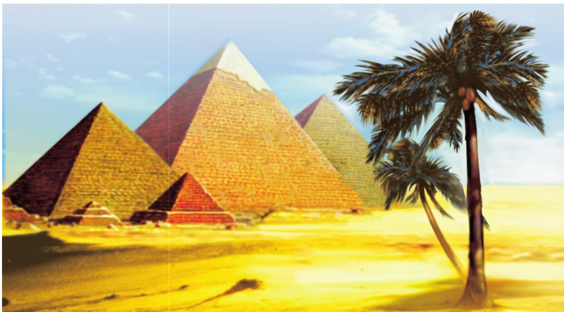
Великие пирамиды Древнего Египта

Великая пирамида Хуфу (у греков этот фараон зовется Хеопсом) была завершена приблизительно в 2850 году до н. э., на ее строительстве трудилось, как считают археологи, до 100000 человек, работавших без устали около 20 лет. Они затаскивали каменные блоки весом около двух тонн каждый по системе пандусов и устанавливали их один на другой без всякого раствора – поверхности подгонялись друг к другу так плотно, что блоки держались на месте сами по себе. (Пожалуй, в Новое время мы можем вспомнить разве что об Александрийской колонне на Дворцовой площади в Санкт-Петербурге, которая тоже стоит на основании без всякого раствора – поверхности подогнаны так плотно, что колонна вот уже почти двести лет стоит как влитая.) Даже по нынешним меркам все эти цифры вполне могли бы попасть в Книгу рекордов Гиннеса.