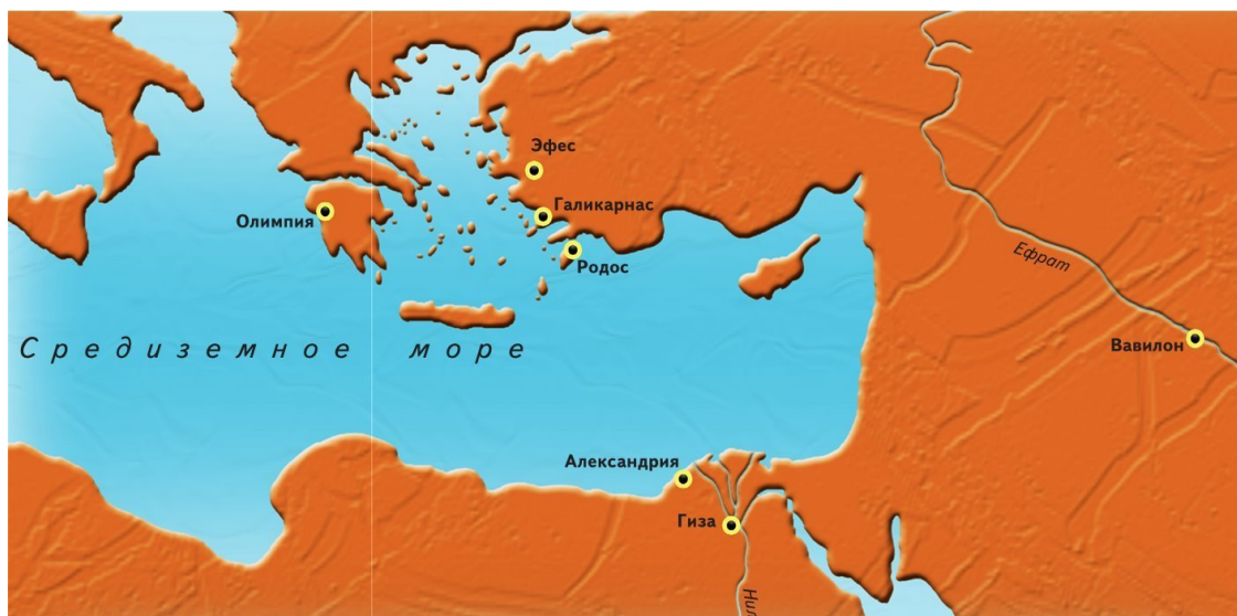
Карта Семи чудес света

Ну и конечно, не обошла своим вниманием это число Библия, где оно называется множеством раз.