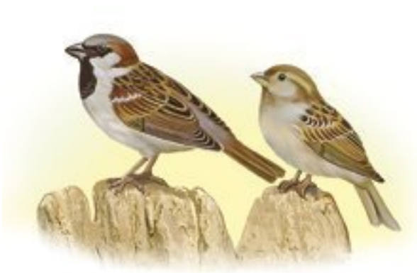
Домовые воробьи (самец и самка)