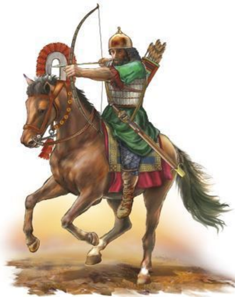
Ассирийский конный лучник в панцире из металлических пластин, около 650 г. до н. э.

Уже в 3500 г. до н. э. в Месопотамии появились первые воины в панцирях из мелких металлических пластинок, связанных между собой кожаными ремешками, заостренных кверху металлических шлемах, со щитами и копьями в руках.