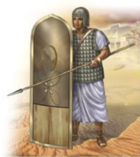
Китайская боевая колесница времен династии Хань