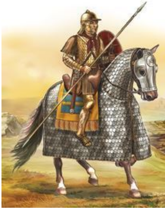
Тяжеловооруженный римский всадник II–IV вв. н. э. Конные рыцари будут похожи на него