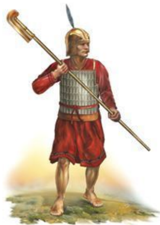
Китайский воин в панцире из костяных пластин, соединенных между собой тонкими кожаными ремешками, XIII–XII вв. до н. э.

Когда около шести тысяч лет назад люди научились выплавлять медь и бронзу, воины получили новое оружие – металлическое. Оно было легче и эффективнее прежних каменных топоров и копий. Так технический прогресс начал служить военным.