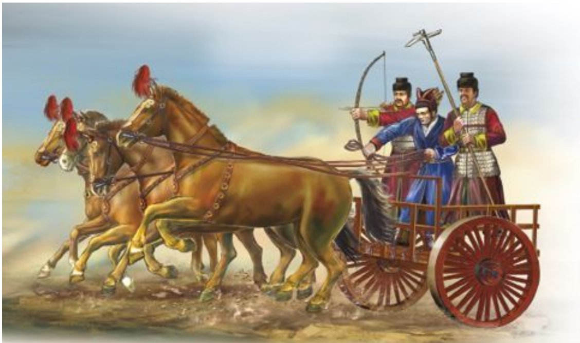
Древнеегипетский воин с копьем и щитом

Мысль творческая не дремала, и очень скоро в своем желании защитить себя от вражеского оружия воины древности научились делать такие эффективные доспехи, что их можно с полным основанием считать прообразом самого совершенного рыцарского снаряжения. Уже древние ассирийцы изготавливали доспехи не только из медных и бронзовых металлических пластин, но и из железа; пластины эти, нашитые на толстую кожу, становились непроницаемыми для стрел.