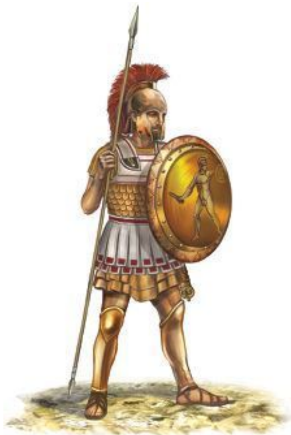
Греческий гоплит конца VI в. до н. э. На нем классический панцирь из медной чешуи на льняной основе, халкидский шлем и гоплитский щит-гоплон