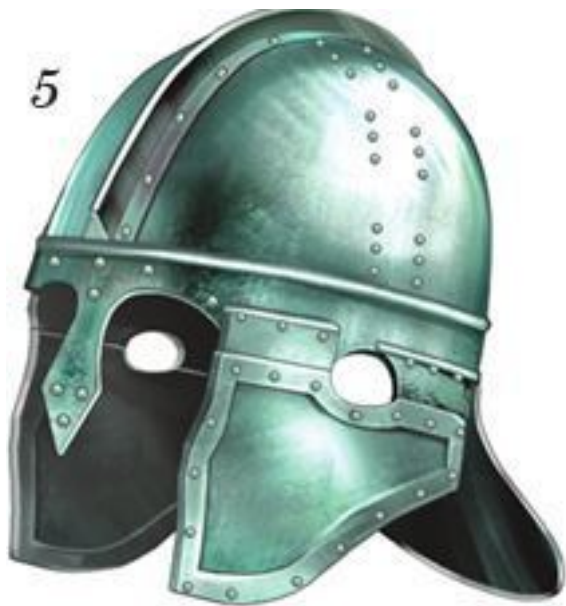
Римские шлемы I–V в. н. э.: