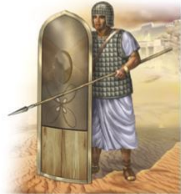
Китайская боевая колесница времен династии Хань