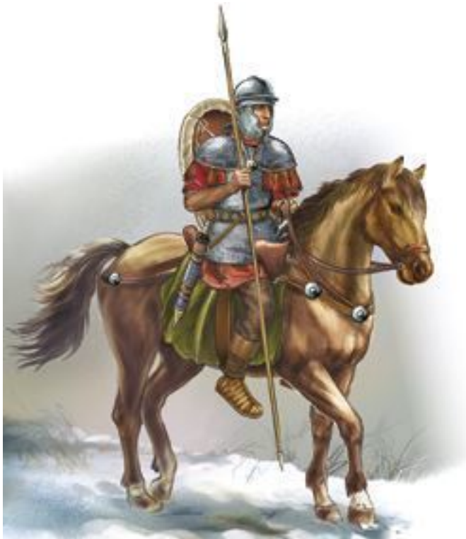
Римский всадник I в. н. э., сидящий в седле без стремян

Шлемы у них имели сфероконическую форму – практически такие же использовали и рыцари. Большие круглые щиты древних обтягивались несколькими слоями кожи, а в состав войска входили не только конные лучники, но и копейщики, имевшие шлем, панцирь, круглый щит и копье – весь