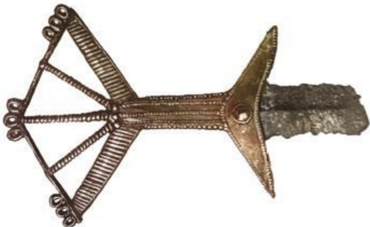
Бронзовая рукоять меча из-под Муroma (лицевая сторона)