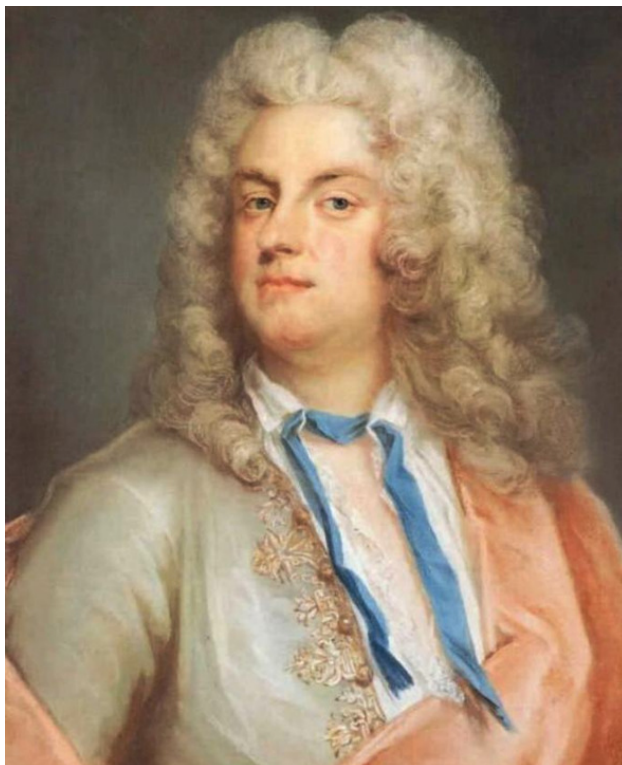
Диттерсдорф Карл Диттерс

С юных лет играл на скрипке в оркестре и вскоре прославился как скрипач-виртуоз. В 1765—69г. занимал (в качестве преемника М. Гайдна) должность капельмейстера в Гросвардейне (Венгрия); в 1770—96г. в Иоганнесберге. Здесь Диттерсдорф организовал маленький театр, для которого сочинял свои оперы. Периодически бывая в Вене, встречался с Й. Гайдном и В.А.Моцартом, с которыми был связан дружбой.