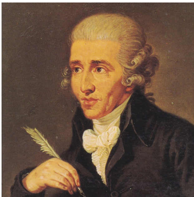
Франц Йозеф Гайдн

Творческий путь Й. Гайдна великого австрийского композитора, старшего современника В. А. Моцарта и Л. Бетховена продолжался около пятидесяти лет, перешел за исторический рубеж XVIII – XIX вв., охватил все этапы развития венской классической школы от ее зарождения в 1760-х гг. вплоть до расцвета творчества Бетховена в начале нового века.