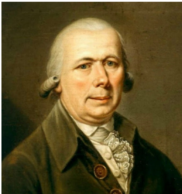
Игнац Якоб Хольцбауэр – австрийский композитор

Изучал право и теологию в Венском университете, однако музыке обучался самостоятельно.