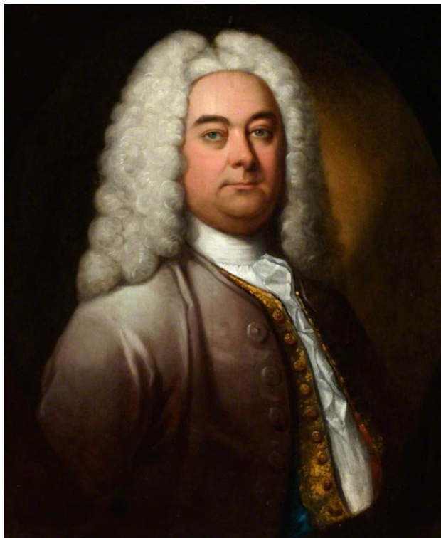
Гендель – композитор эпохи Просвещения

Гендель открыл новые перспективы в развитии жанра оперы и оратории, предвосхитил многие музыкальные идеи последующих столетий – оперный драматизм К. В. Глюка, гражданственный пафос Л. Бетховена, психологическую глубину романтизма.