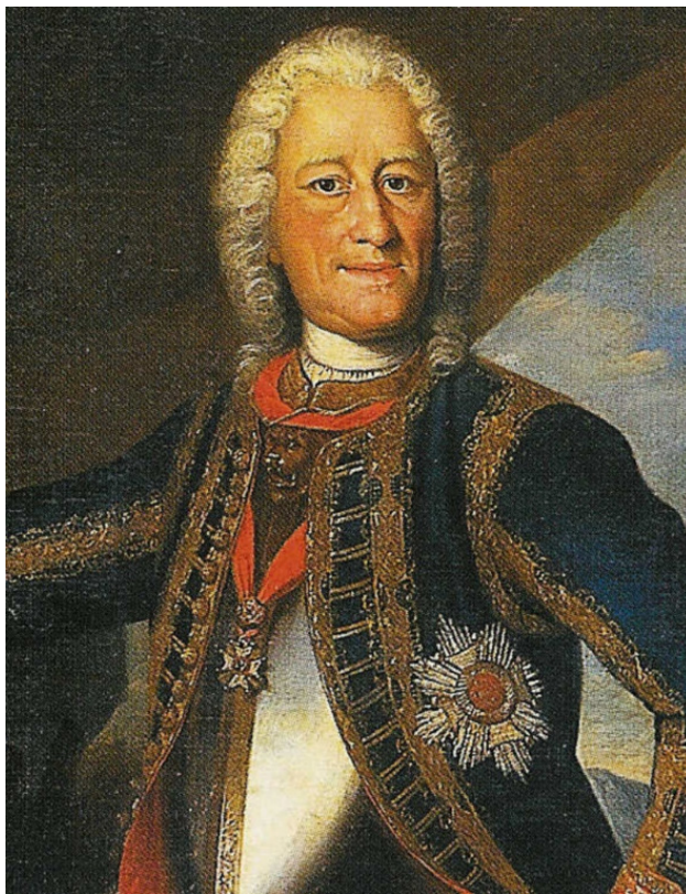
Райнхард Кайзер – немецкий композитор.

Учился у своего отца, известного в свое время органиста и композитора Готфрида Кайзера, затем в школе при лейпцигской церкви Св. Фомы. С 1694 г. связал свою судьбу с гамбургским оперным театром. В 1717—27 гг. служил капельмейстером во многих европейских странах, в 1728 г. вернулся в Гамбург. В 1731 г. посетил Россию, побывав в С.-Петербурге и Москве.