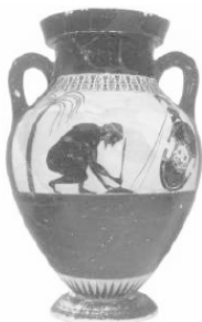
Рис. 1. Греческая ваза 6 века до н. э., с изображением самоубийства Аякса.

Тем не менее, именно Гиппократ является основателем научной медицины, и в том числе научной психиатрии. Он был первым, кто признал, что боги не влияют на развитие человеческих заболеваний, и высказывал мысль, что причиной «святой болезни», которую мы теперь знаем как эпилепсия, являются нарушения работы головного мозга. Помимо его великой работы «Гиппократов сборник» , Гиппократ является автором нескольких сотен кратких высказываний (афоризмов) относительно патогенеза и лечения различных болезней. Возможно также, что именно Гиппократ ввел термин «афоризм» в том смысле, который используется многочисленными мыслителями до наших времен. Среди афоризмов Гиппократа имеются и те, которые касаются меланхолии. В одном из них он обращает наше внимание на аспект периодичности заболевания: «Все заболевания возникают во все