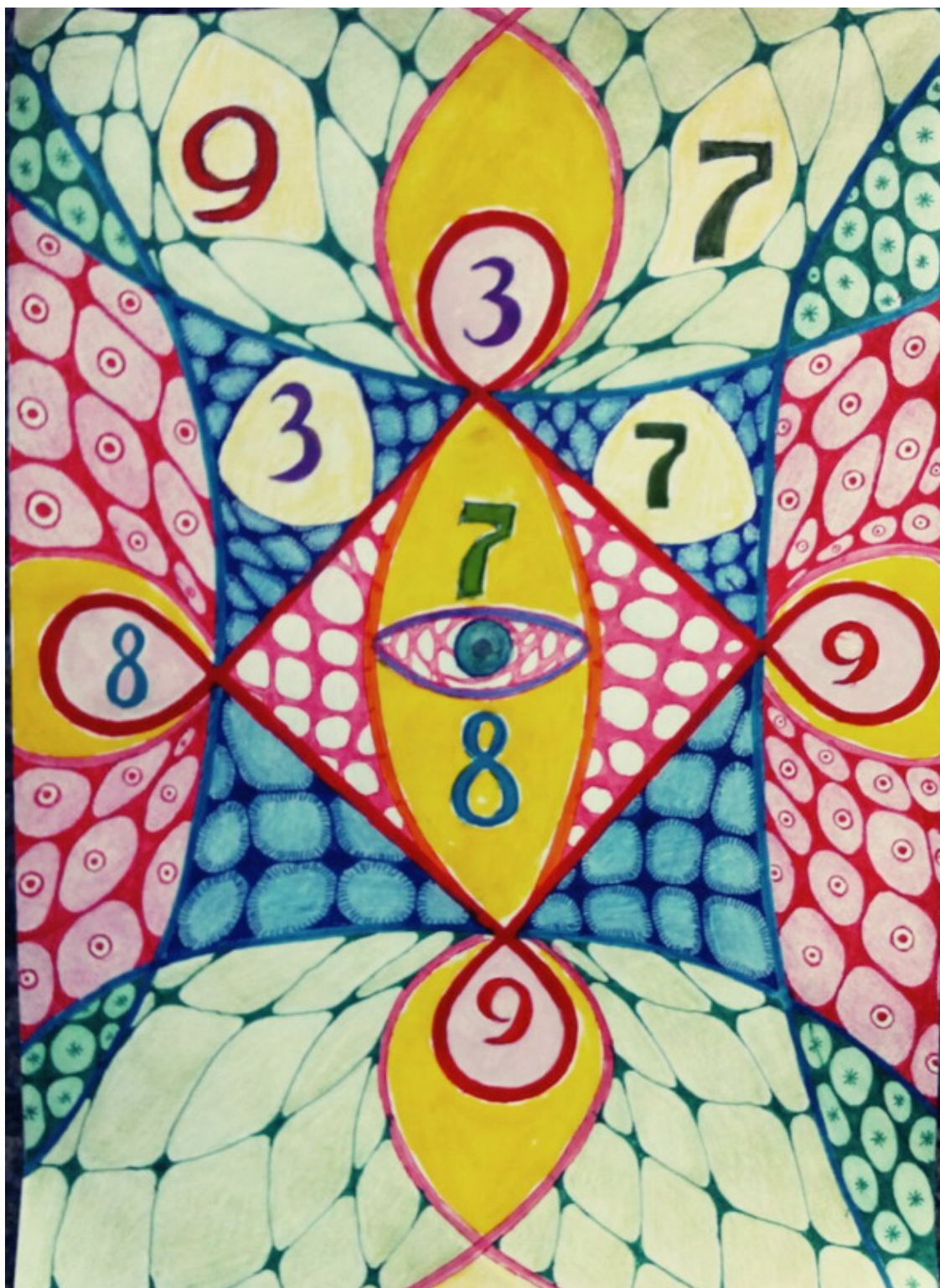
Автор Вера Кальченко