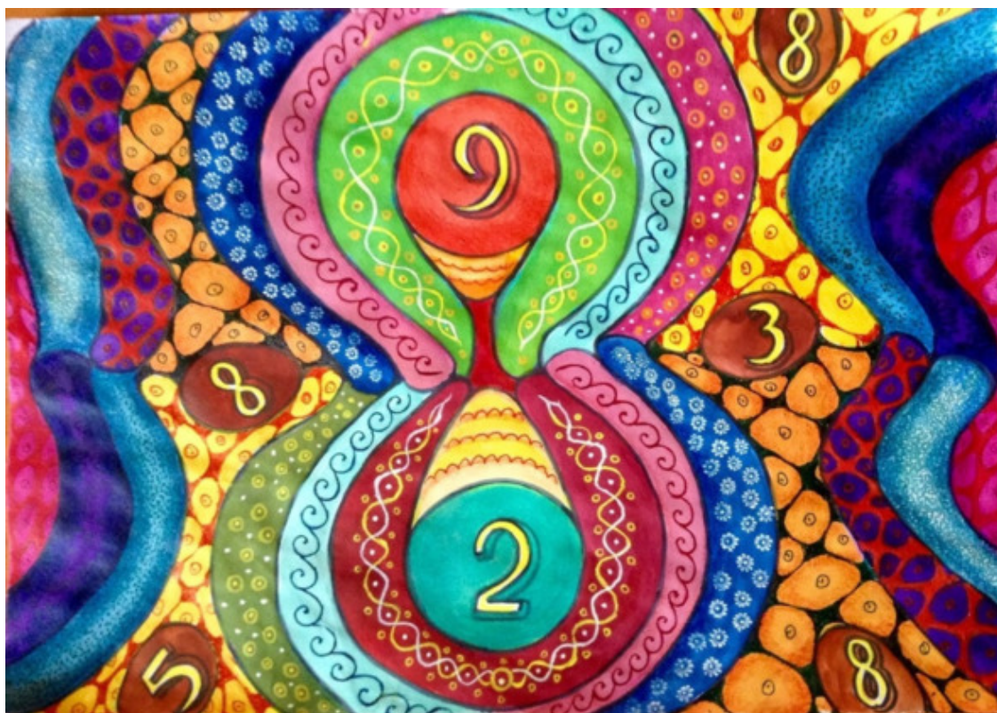
Автор Вера Кальченко