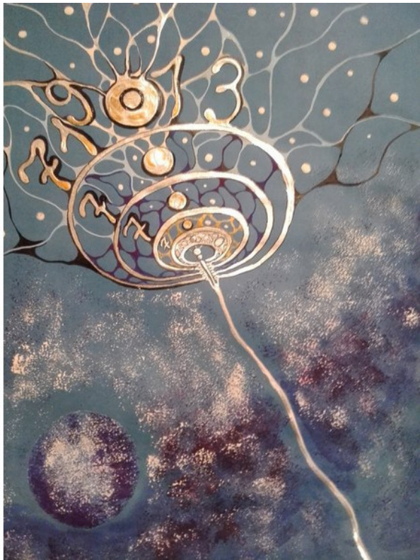
Числографическая картина. Автор Анна Трещинская