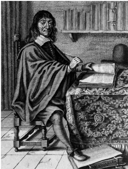
Рене Декарт (1596 – 1650)

В этой работе Декарт предложил гипотетический механизм, объясняющий реакцию организма на внешнее воздействие. Согласно модели Декарта, внешний раздражитель действует на периферические окончания нерва, вызывая смещение центрального (находящегося в нервной системе) конца нерва. В результате такого смещения происходит изменение конфигурации межнервных промежутков, по которым на периферию устремляется поток жизненной энергии. Именно эта модель Декарта в современном естествознании принимается за начальную точку развития рефлектор-