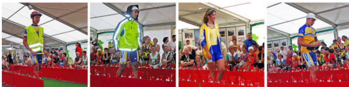
Демонстрация велосипедной одежды от ведущих модельеров и производителей Франции. Здесь определяется веломода сезона!

Полезная информация для тех, кто собирается на Федеральную французскую велонеделю. В этом мероприятии участвует большое количество велосипедистов и, соответственно, приезжает множество продавцов велотоваров. Но не следует сразу же, лететь к лоткам и спешить немедленно опустошить свои кошельки! Поскольку у подавляющего числа гостей велонедели всё необходимое для велосипеда давно уже имеется, и это имеющееся в большинстве своём, скорее лучшее, чем хорошее, то покупателей на самом деле оказывается немного. Поэтому уже через пару дней начинается приличный сброс цен, скидки, распродажи. Скорее всего, это не коснётся самых новых образцов велопродукции, но и тот товар, что пойдет по сниженным ценам, будет вовсе не плох.