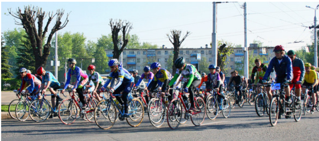
Велоклуб «Сура-марафон» стартует на двести

Так или иначе, а на первую в Пензе «двухсотку» вышло около 30 человек. Не всем она оказалась по плечу, не всем сразу пришлось по вкусу новые идеи продолжительной езды на велосипеде. Но все преодолевшие марафон сразу перешли в новое качество. На неофициальную «трёхсотку» вышло шесть человек, а прошло только трое. Тем не менее, костяк клуба обозначился. В 2005 году успешно были пройдены марафоны с «четырёхсоткой» включительно. В 2006 году прошла полная серия марафонов 200-300-400-600 километров и пять членов клуба выполнили требования АСР для получения звания «Супервеломарафонец» (Superrandonner).