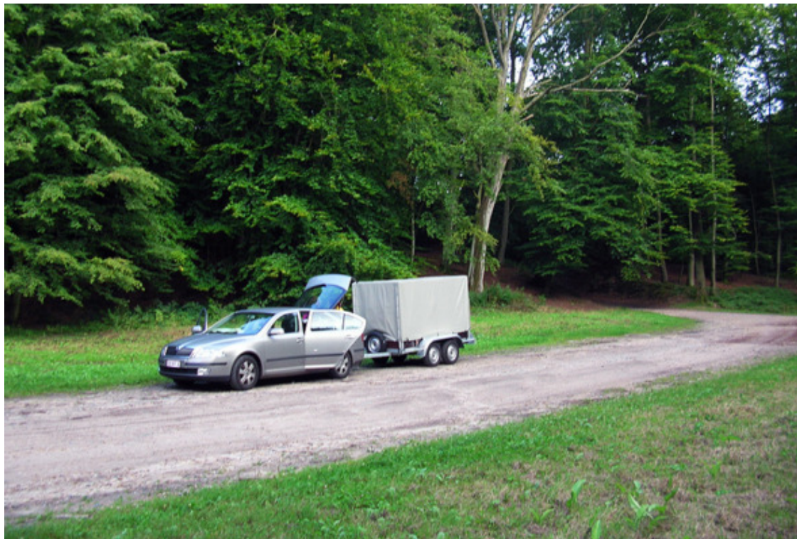
Перед ночевкой в заповедном лесу

так, дерево не исчезнет! Людей не встретили, но несколько раз видели, как осторожные олени по очереди переходят дорогу.