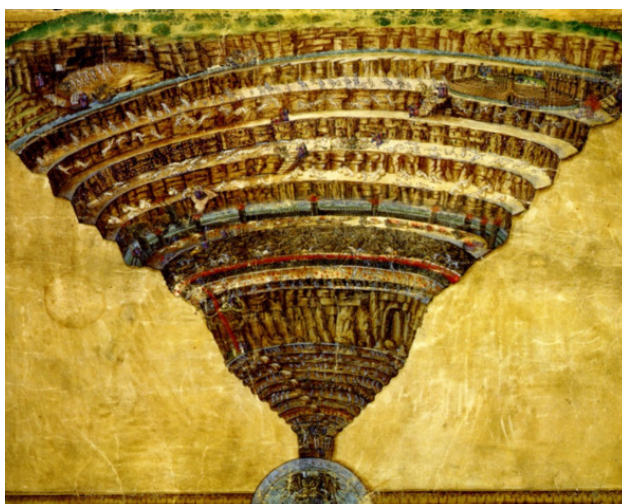
Сандро Ботичелли «Карта Ада»

– Есть одна теория. Когда я увидел похожий рисунок, причем на Земле, я придумал теорию, что некогда наши миры соединялись вместе из-за пространственно-временных сдвигов. По крайней мере, можно объяснить, как на картинах художников древних времён оказывались такие сюжеты. Но теперь я в полном шоке. Выходит, что в пространственно-временном сдвиге участвовала Меньотта. Иначе, как объяснить это изображение?