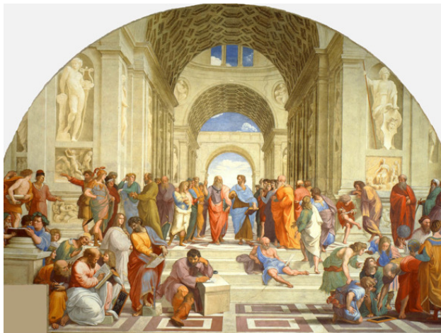
Рафаэль Санти «Афинская школа»

знаменитой фреской «Афинская школа» работы Рафаэля. Некоторое время, затаив дыхание, Лора с благоговением и почти не дыша взирала на одно из величайших творений мастера.