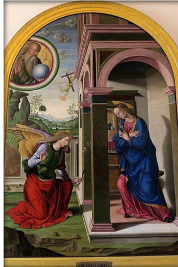
Джованни Санти «Благовещение»

«Определённо, этот Джованни что-то знал, и передал это сыну», – подумала Лора. Она любовалась фреской, одновременно оценивая и анализируя старинное изображение. «Опять то же самое! На переднем плане всё понятно. А вот вверху слева: в полукруге человек держит сферу. Кто это? Бог? Хорошо, согласна, Бог. Но почему в руке шар? Это что? Земля? Или другая планета? Зачем художник изобразил этот предмет? А на заднем плане: стоит младенец одной ногой на облаке и держит крест. Кто это? Ангел? Но крыльев-то нет. В общем странно. А самое главное – пейзаж опять не похож на земной. Больше Сапфиру напоминает». Оглянувшись и приняв невидимость, Лора принялась исследовать фреску и с удовлетворением нашла две почти микроскопические латинские буквы «i». На обратном пути в Рим Лора напряжённо думала: «В Италии мне делать больше нечего. Зацепок нет. Осталась единственная картина в Петербурге. Но я итак там буду, когда прилечу. Значит пора возвращаться».