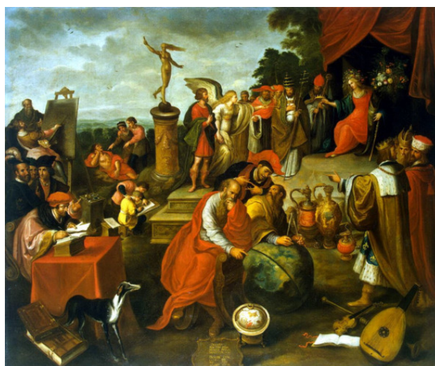
Ф. Франкен «Аллегория случая»