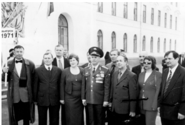
111-я учебная группа в родном МВИРТУ через 40 лет