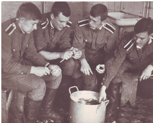
Операция по вырезке картофельных глазков

Основная задача, занимавшая уйму времени наряда, – вырезание так называемых «глазков» у картошки. Чистила её спецмашина, но она оставляла чёрные «глазки». Эти черные точки должны были удалять пять человек, назначенные в наряд, а картошка-то чистилась на всё училище!