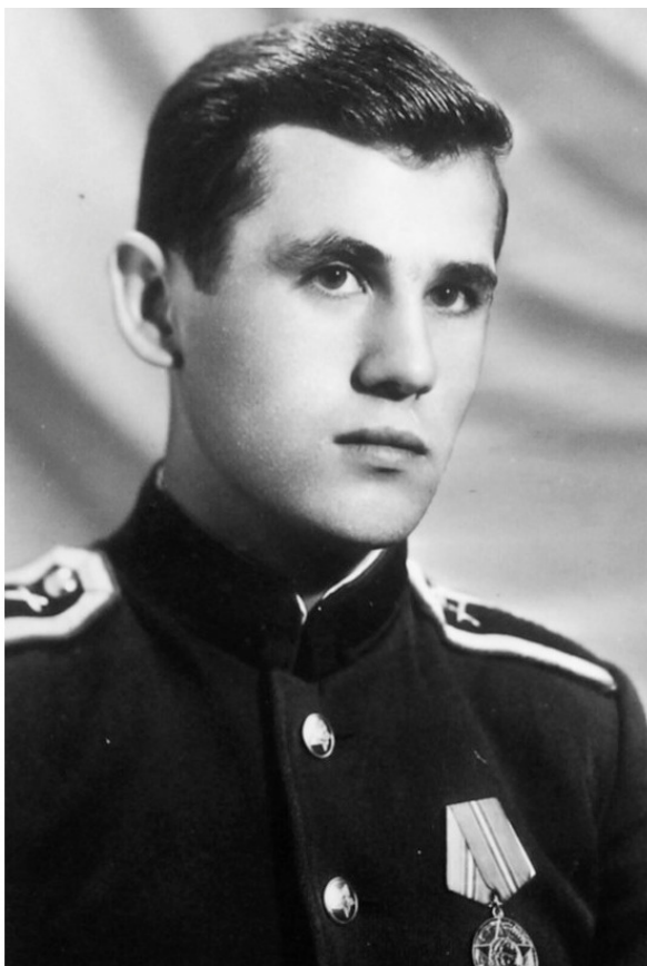
3-й курс МВИРТУ. 1969