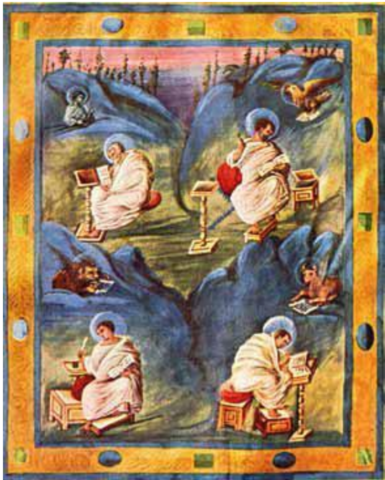
Четыре Евангелиста. Миниатюра Ахенского Евангелия. Ок. 820 г.