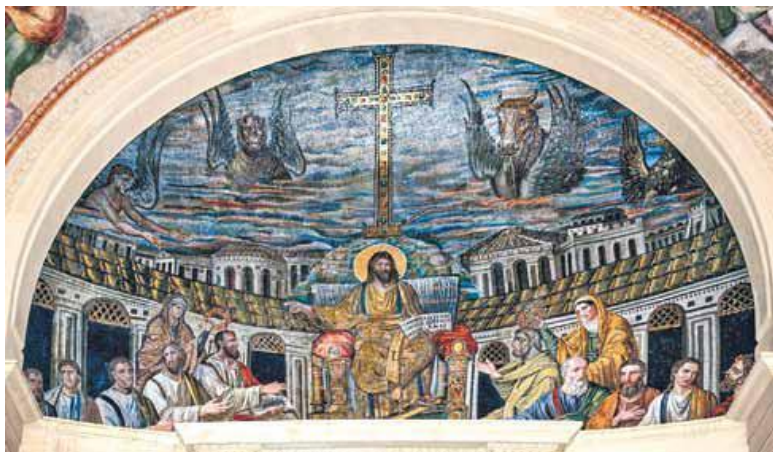
Символы Евангелистов. Христос и апостолы.

Самый большой парадокс, связанный с воскресением Иисуса Христа, заключается в том, что этого события никто не видел. Все четыре Евангелиста утверждают, что Иисус воскрес, но ни один из них не рассказывает, как это произошло. В тот момент, когда рано поутру в первый день недели женщины приходят к погребальной пещере, где было положено тело Иисуса, они обнаруживают, что тела там нет. Но каким образом оно исчезло, Евангелисты не рассказывают, потому что прямых свидетелей у этого события не было.