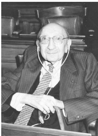
Анри Барюк в последние годы жизни

психиатрическое движение «поднимало на щит» его высказывания. Наоборот, он последовательно защищал право пациентов на получение своевременной, качественной и, что он особенно подчеркивал, гуманной психиатрической помощи.