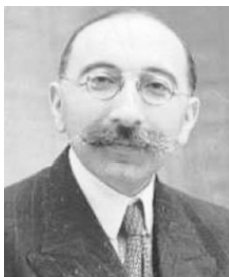
Анри Барюк (Henri Baruk) (1897–1999)

Анри Барюк родился 15 августа 1897 г. в Сент-Аве (Морибане) в еврейской медицинской семье. Он был сыном известного в то время психиатра Жака Барюка. Фамилия «Барух», трансформированная на французский лад в «Барюк», означает на иврите буквально «Благословенный Богом». В полном соответствии с фамилией и сам А. Барюк, и семья его были глубоко религиозны.