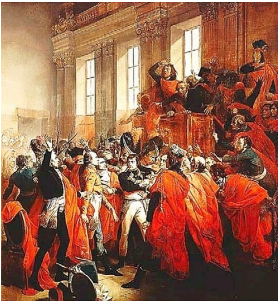
Конец французской революции.

«Вышвырните-ка мне всю эту публику вон!» – скомандовал он солдатам.