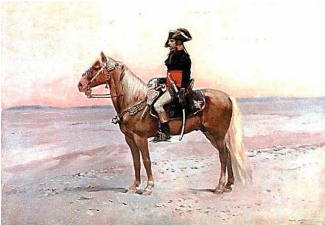
Конец Египетского похода

ников, он не будет в состоянии долго держаться в Египте. Послав об этом донесение Директории, он вступил с великим визирем в переговоры об оставлении Египта.