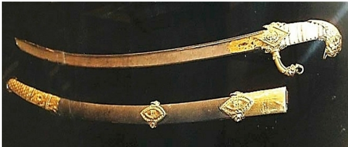
Сабля великого французского оружейника Николя Бутэ.

Наполеон осторожно вытянул из ножен клинок. На матово блестящей поверхности была золотыми буквами выбита надпись: « Н. Бонапарт. Первый консул республики французов ».