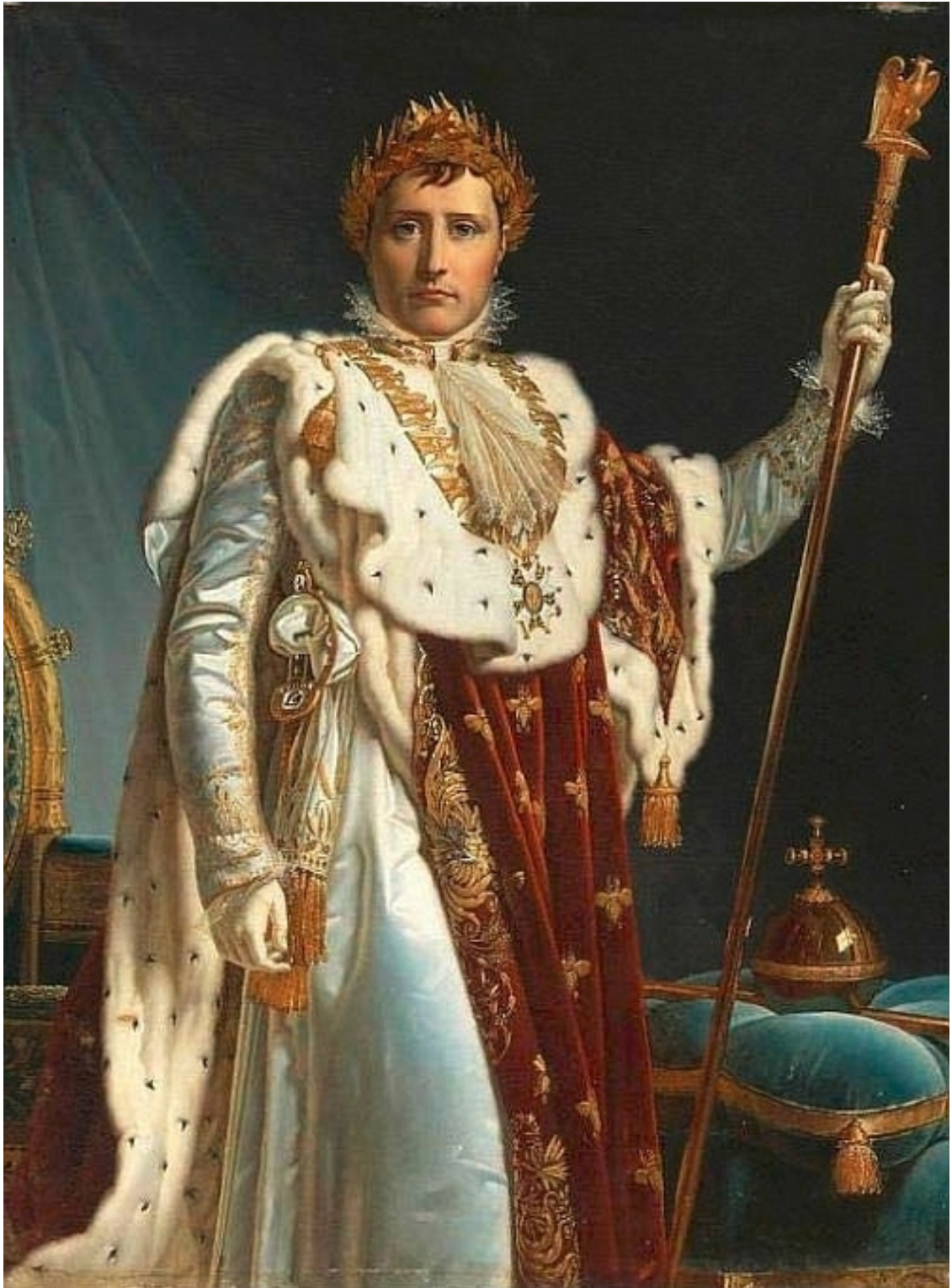
Коронация Наполеона Бонапарта

Новоявленный император выглядел чрезвычайно роскошно: в пурпурном бархатном одеянии, коротких штанах-буфах, белых чулках, вышитых драгоценными камнями.