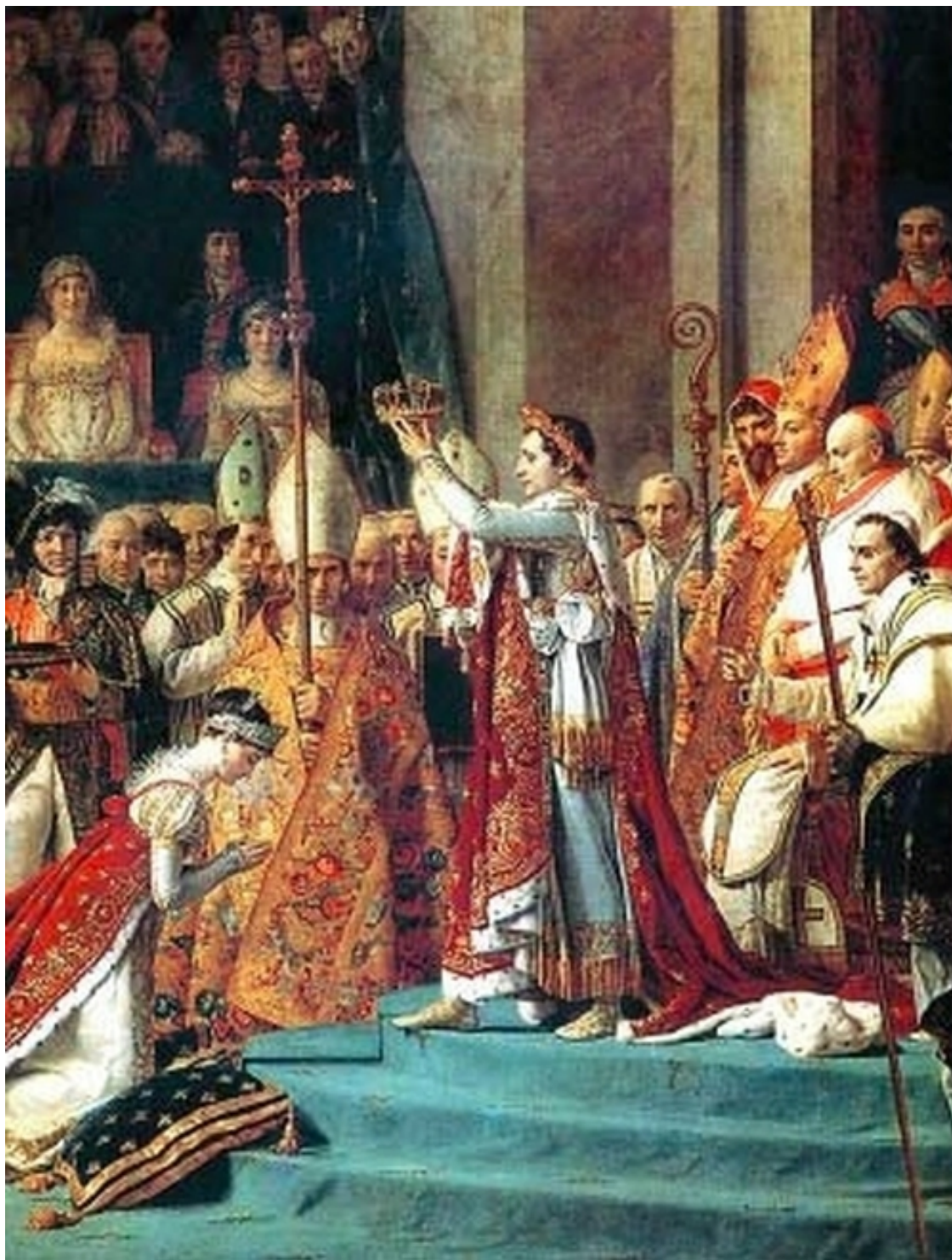
Коронация Жозефины Богарне. Жак Луи Давид. Лувр, Париж

Началась эпоха империи Наполеона, которая закончилась ровно через 10 лет в марте 1814 года.