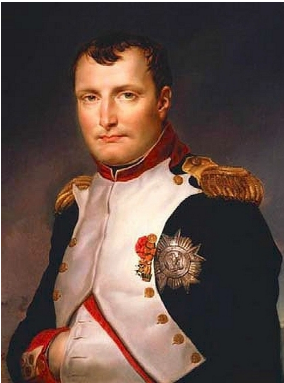
Генерал Наполеон Бонапарт – первый консул Франции.

Уже через две недели к первому консулу прибыла делегация старшин Парижа, чтобы выразить ему свою поддержку.