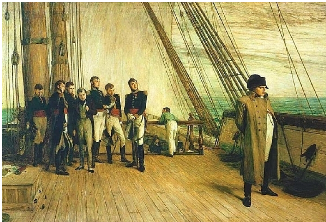
Возвращение Наполеона во Францию после Египетского похода.

Уже начали различаться очертания собора Святого Леонтия и строения порта, заложенного еще Юлием Цезарем. Скоро, очень скоро Наполеон снова ступит на землю Франции.