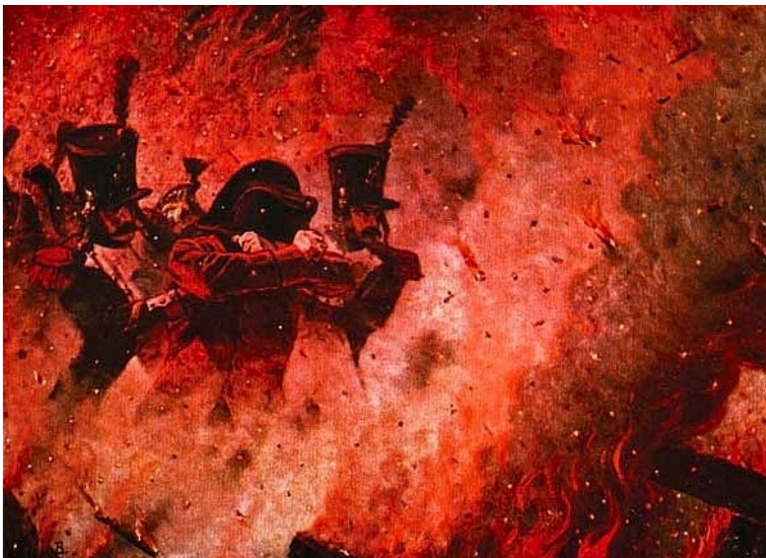
Пожар в Москве. Наполеона эвакуируют из Кремля в Петровский подъездной дворец.

Сначала загорелся Гостиный двор на Красной площади, напротив Кремля. Потом запылало на Солянке и Яузской улице, возле Воспитательного дома, загорелся Винно-Соляной двор, барки с сеном, стоявшие на Москве-реке. На следующий день занялось Замоскворечье. Днем загорелись Китай-город, Покровка и Немецкая слобода, Остоженка, Пречистенка, Арбат, хлебные и артиллерийские склады на Москве-реке, полыхнуло в Каретном ряду. По деревянному городу пожар распространялся стремительно.