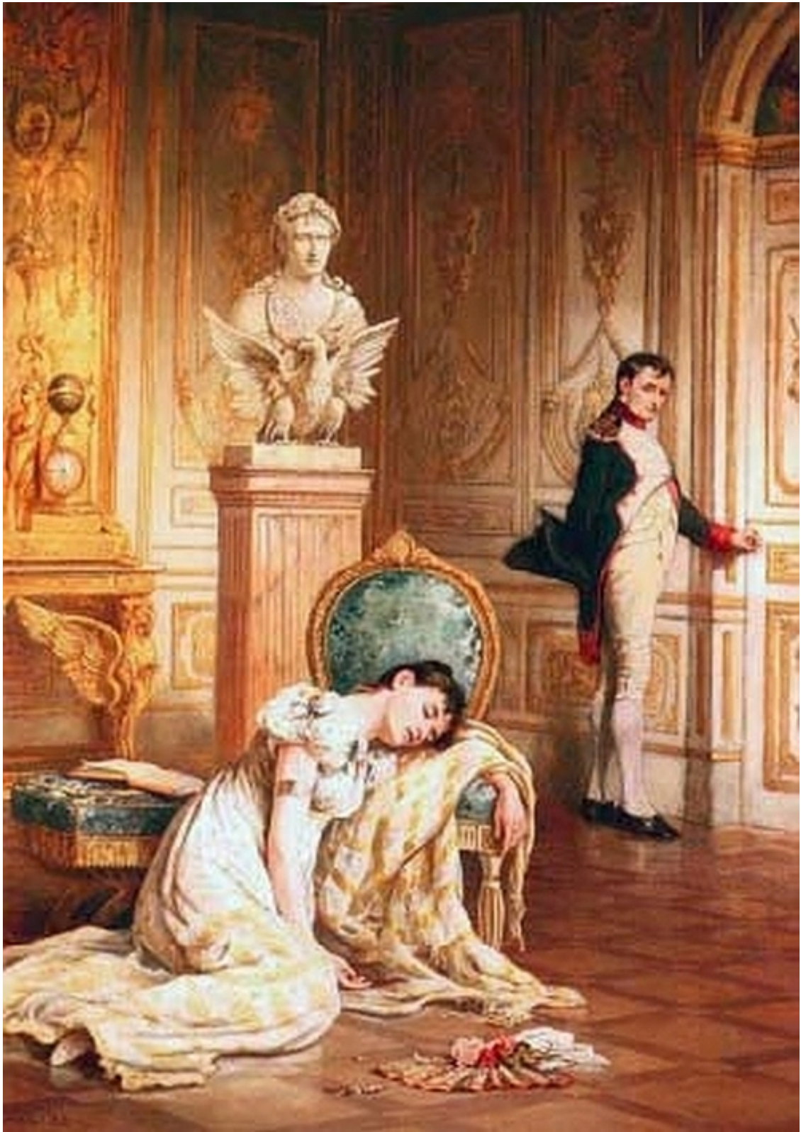
Император Бонапарт объявляет Жозефине о разводе.

Как императрица Жозефина, благодаря своей доброте, щедрости и такту, пользовалась во Франции большой популярностью, однако несколько лет спустя, когда неспособность Жозефины родить ребёнка больше не вызывала сомнений, Наполеоном было принято решение о разводе.