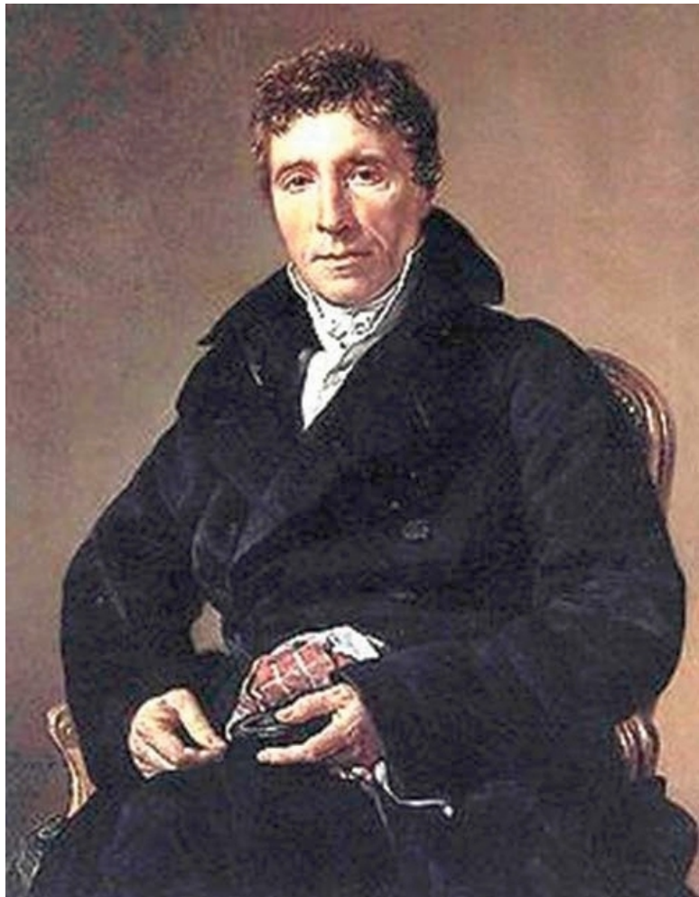
Аббат Сийес Эммануэль-Жозеф