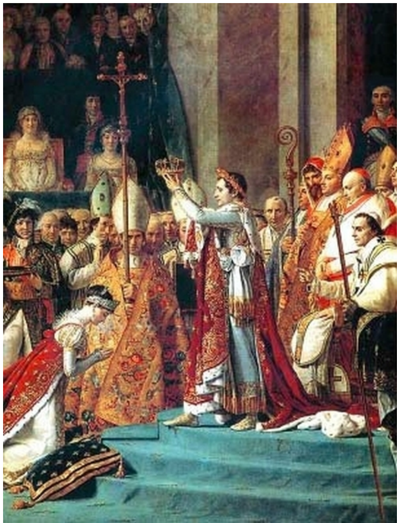
Коронация Жозефины Богарне. Жак Луи Давид. Лувр,