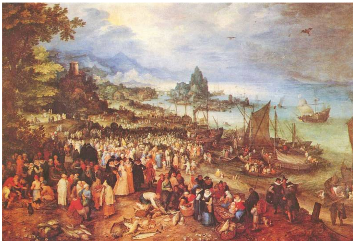
Гавань с проповедующим Христом. XVII в. Ян Брейгель Старший (Старая пинакотека, Мюнхен)

И опять начал учить при море; и собралось к Нему множество народа, так что Он вошел в лодку и сидел на море, а весь народ был на земле, у моря. И учил их притчами много, и в учении Своем говорил им: слушайте... (Мк. 1:1–3).