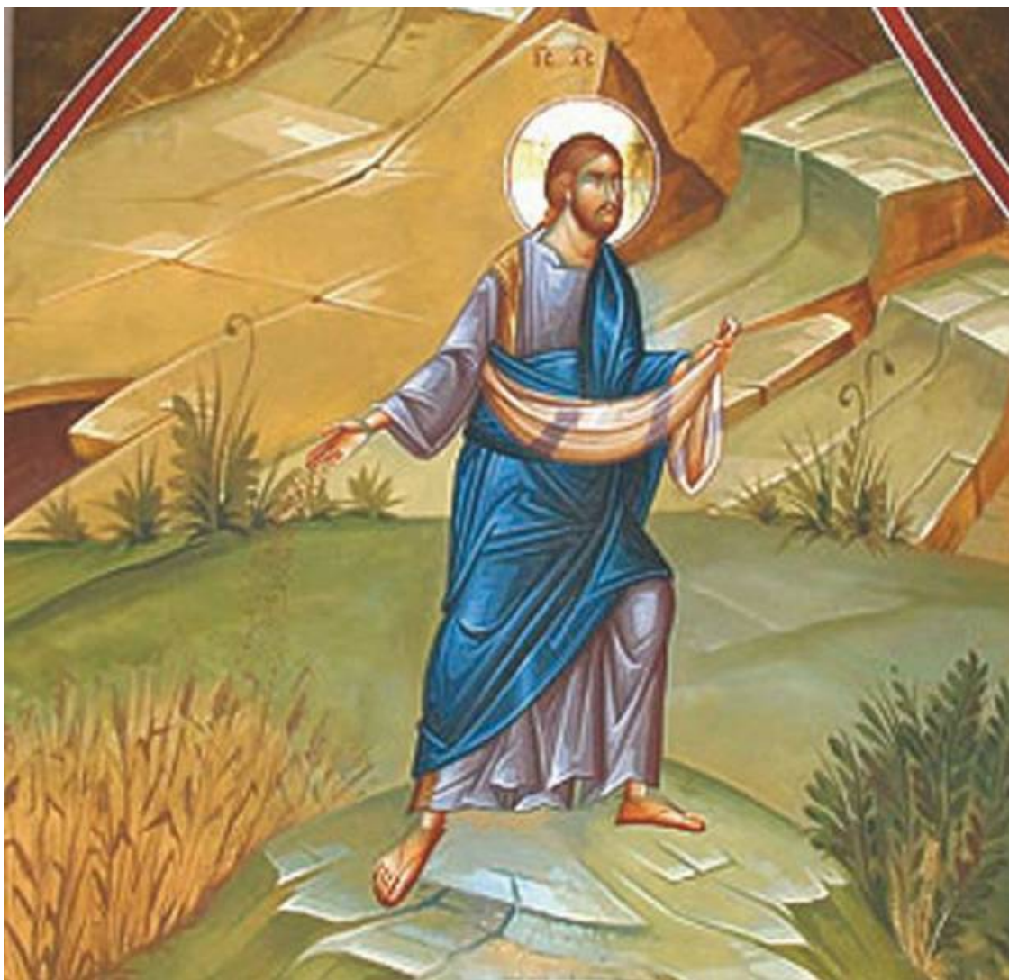
Притча о сеятеле. Фреска кафоликона монастыря на горе Фавор. XXI в.

Притча о сеятеле является первой притчей Иисуса Христа, изложенной в Евангелии от Марка. Она также является первой самостоятельной притчей в Евангелиях от Матфея и от Луки, если не считать притчи о доме на камне и доме на песке, вправленной в Нагорную проповедь (у Луки – в «Проповедь на равнине»), и притчи о детях на улице, вкрапленной в поучение об Иоанне Крестителе. Наличие притчи о сеятеле у всех трех синоптиков и то положение, которое она занимает в каждом из трех синоптических Евангелий, заставляют нас начать анализ притч Иисуса именно с нее.