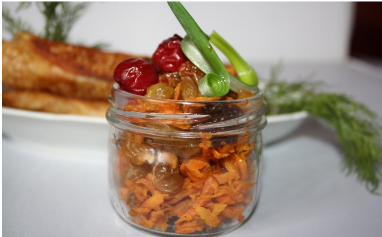
Блинчики с яблоками