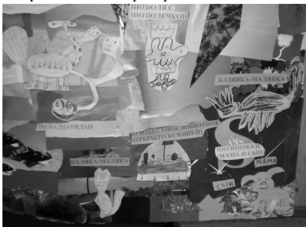
Рис. 3. Пример групповой работы на тему «Необычный зоопарк»

Завершало цикл итоговое занятие «Необычный зоопарк, или „там на неведомых дорожках следы невиданных зверей“». В ходе него использовалась совместная групповая работа. Дети разделились на две группы – мальчиков и девочек. Им было предложено создать на листе ватмана формата А1 коллаж под общим названием «Зоопарк». Сначала они создавали среду обитания, а потом уже помещали в нее животных. Образы животных были взяты автором из теста «Несуществующее животное»: рисунки детей были скопированы, а также заранее были подготовлены подписи с названиями этих животных. Получилось два коллажа, которые затем были объединены в один и размещены в коридоре гимназии.