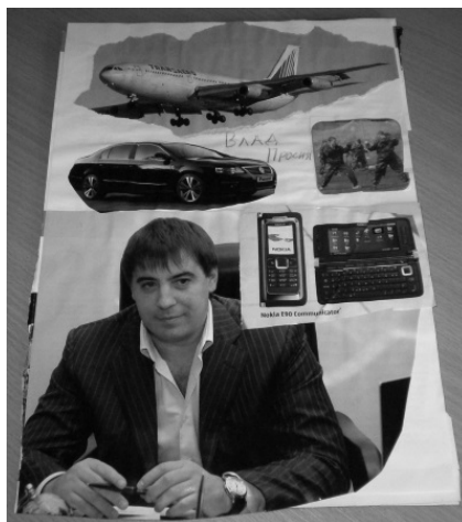
Рис. 1. Пример фотоколлажа на тему «Вперед, в будущее!»

На занятии «Моя планета» автор использовала сказку «Маленький принц» Антуана де Сент-Экзюпери, в которой есть описание различных планет. Эта сказка помогла «вести» детей в тему занятия. Далее детям было предложено создать изображение их собственной планеты в технике коллажа, а также дать ей название. Так появились: Планета зверей, Планета крутых тачек, Планета памятников, Планета красоты, Планета «Мой рай», Планета картин, Планета денег, Интересная планета, Планета машин и много других планет.