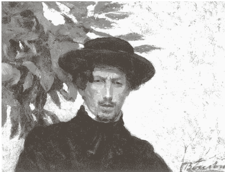
Рис. 9.У. Боччони. «Автопортрет», 1905