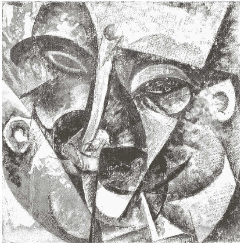
Рис. 10. У. Боччони. «Динамизм мужской головы», 1913