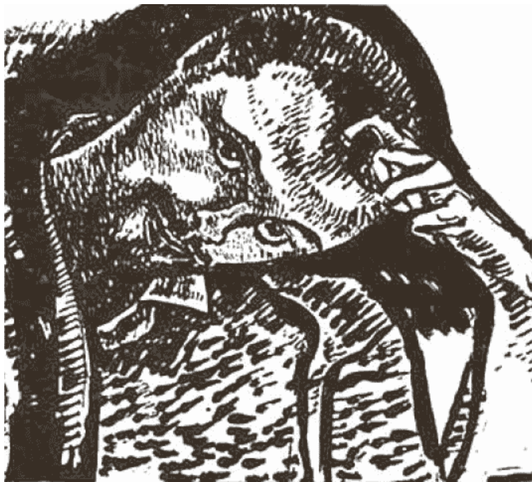
Рис. 7. П. Клее. «Автопортрет», 1911