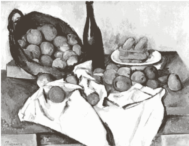
Рис. 5. П. Сезанн. «Натюрморт с корзиной яблок», 1890–1894