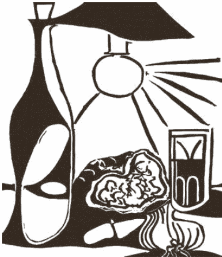
Рис. 6. П. Пикассо. «Натюрморт с бутылкой и лампой», 1962

Напротив, в этюде П. Пикассо царит кажущаяся беспо-