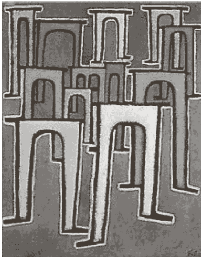
Рис. 8. П. Клее. «Революция виадуков», 1937