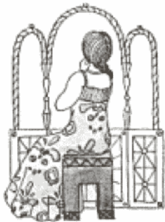
Рис. 12. Работа студента художественного факультета. Пример неправильного выделения «фигуры на фоне»