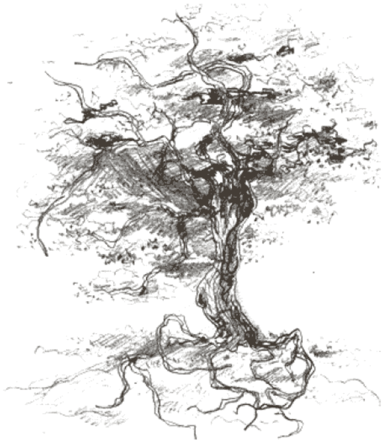
Рис. 14. Работа студента художественного факультета.