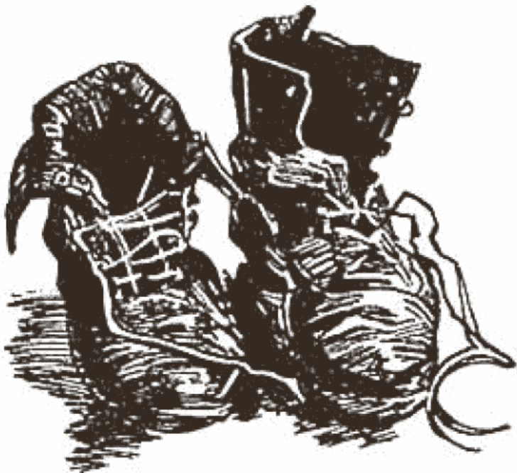
Рис. 2. В. Ван Гог. «Пара башмаков», 1886

Что же вызывает у созерцающего произведение искусства ощущение его выразительности: свойства цвета, структура композиции, форма изображенных предметов или соотношение художественных образов с эстетическими установками и мировоззрением?