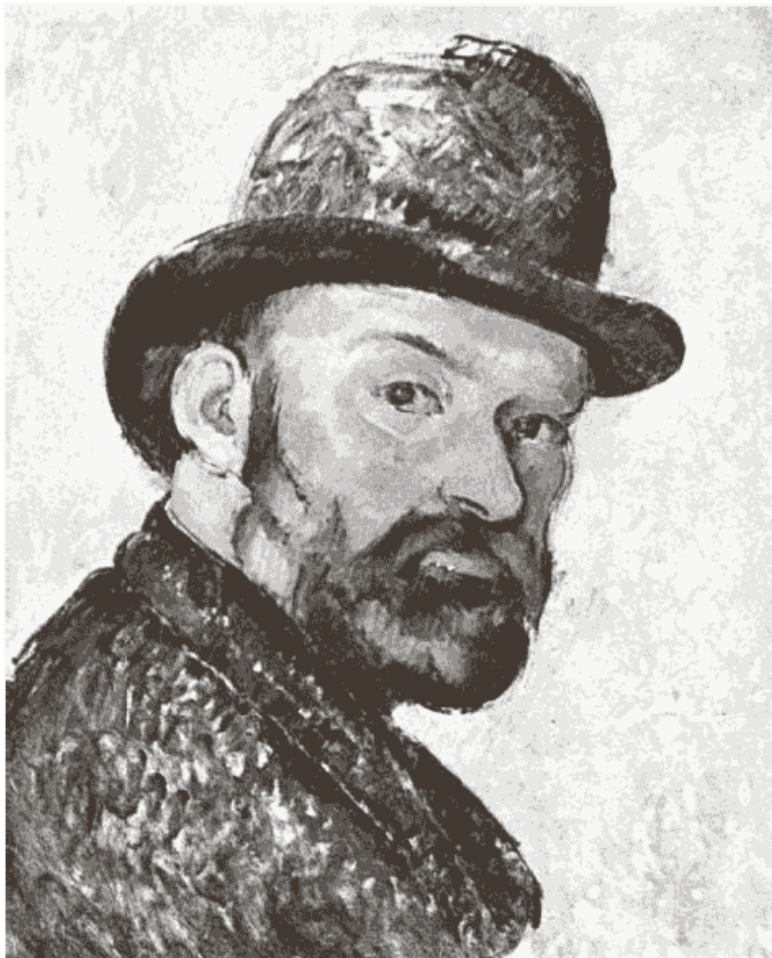
Рис. 3. П. Сезанн. «Автопортрет», 1883–1887