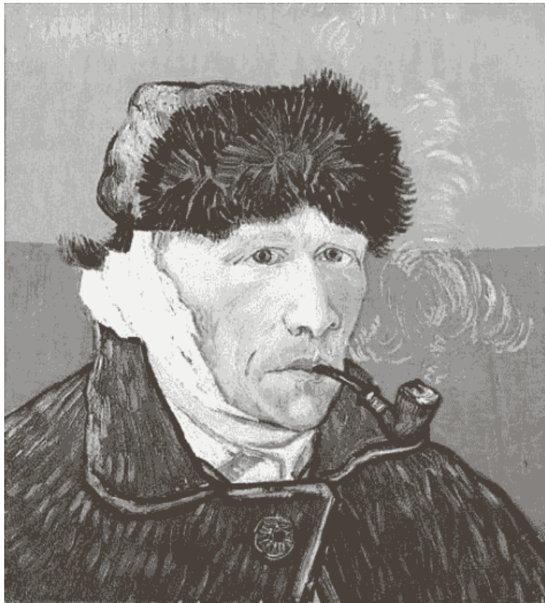
Рис. 1. В. Ван Гог. «Автопортрет с отрезанным ухом», 1889