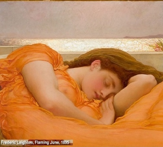
Frederic Leighton, Flaming June, 1895