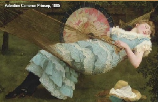
Valentine Cameron Prinsep, 1885