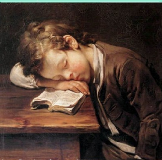
Jean-Baptiste Greuze, 1755