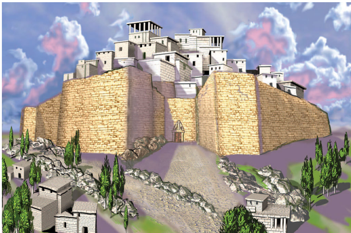
Микены – один из древнейших городов Греции