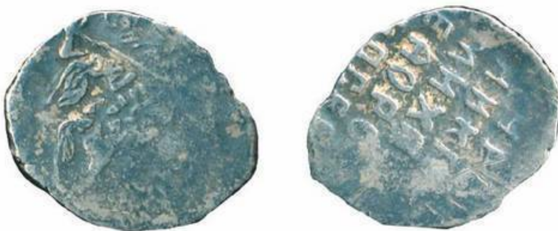
Русская старинная монета «чешуйка» времен Михаила Федоровича

год юная царица умерла – кто-то из зависти отравил ее. В 1626 году Михаил сыграл пышную свадьбу с Евдокией Лукьяновной Стрешневой, красивой, но незнатной дворянской дочерью, которая и родила ему сына Алексея – будущего царя.