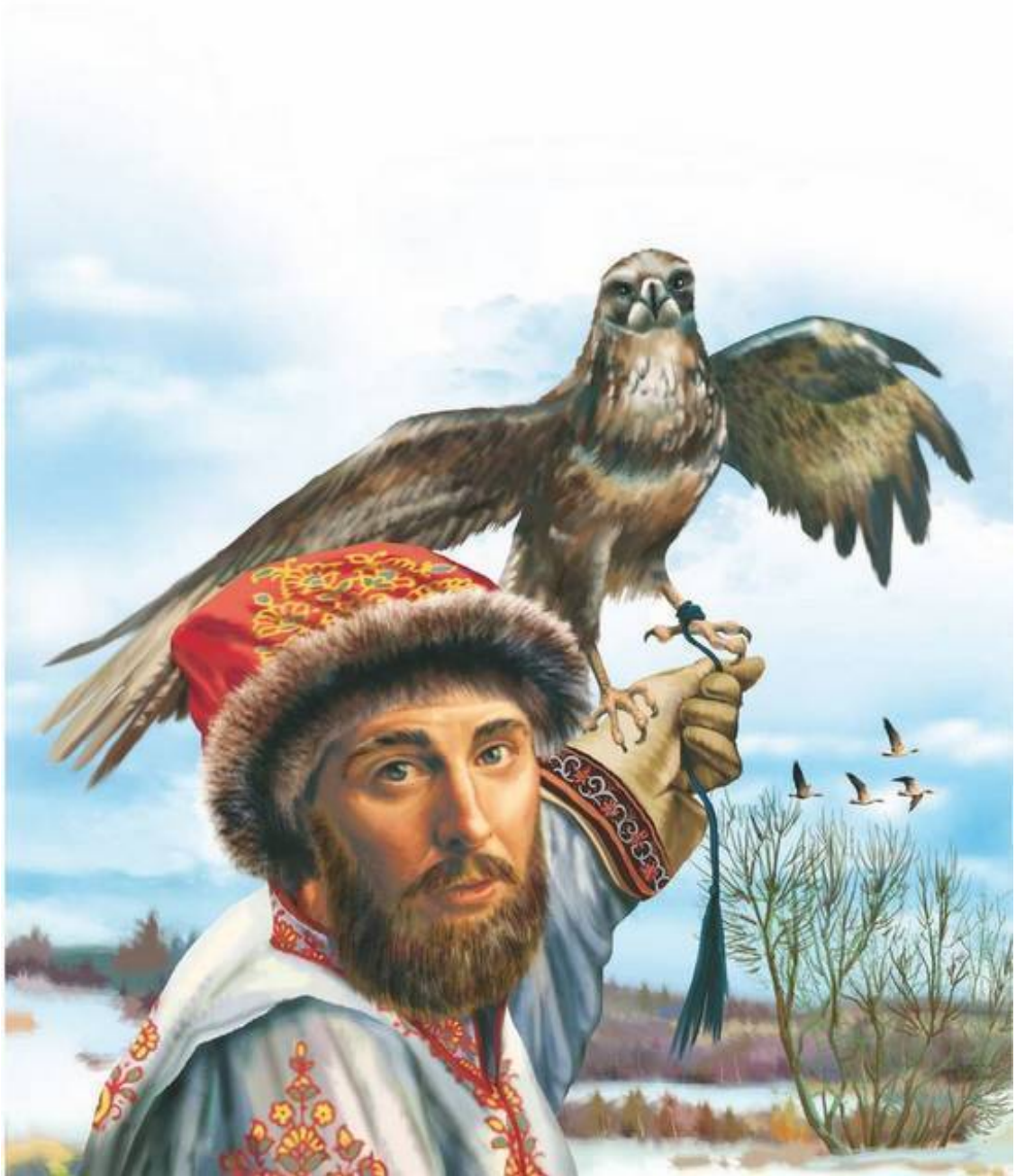
Алексей Михайлович на соколиной охоте

При Алексее Михайловиче Россия добилась многих успехов. Этому немало способствовали советники царя, первым из которых был боярин Б. И. Морозов. Он даже породнился с царем – оба женились на сестрах Милославских. Но вскоре Морозов был уличен в злоупотреблениях, вызвал всеобщую ненависть. Социальный взрыв произошел в 1648 году, когда Моро-