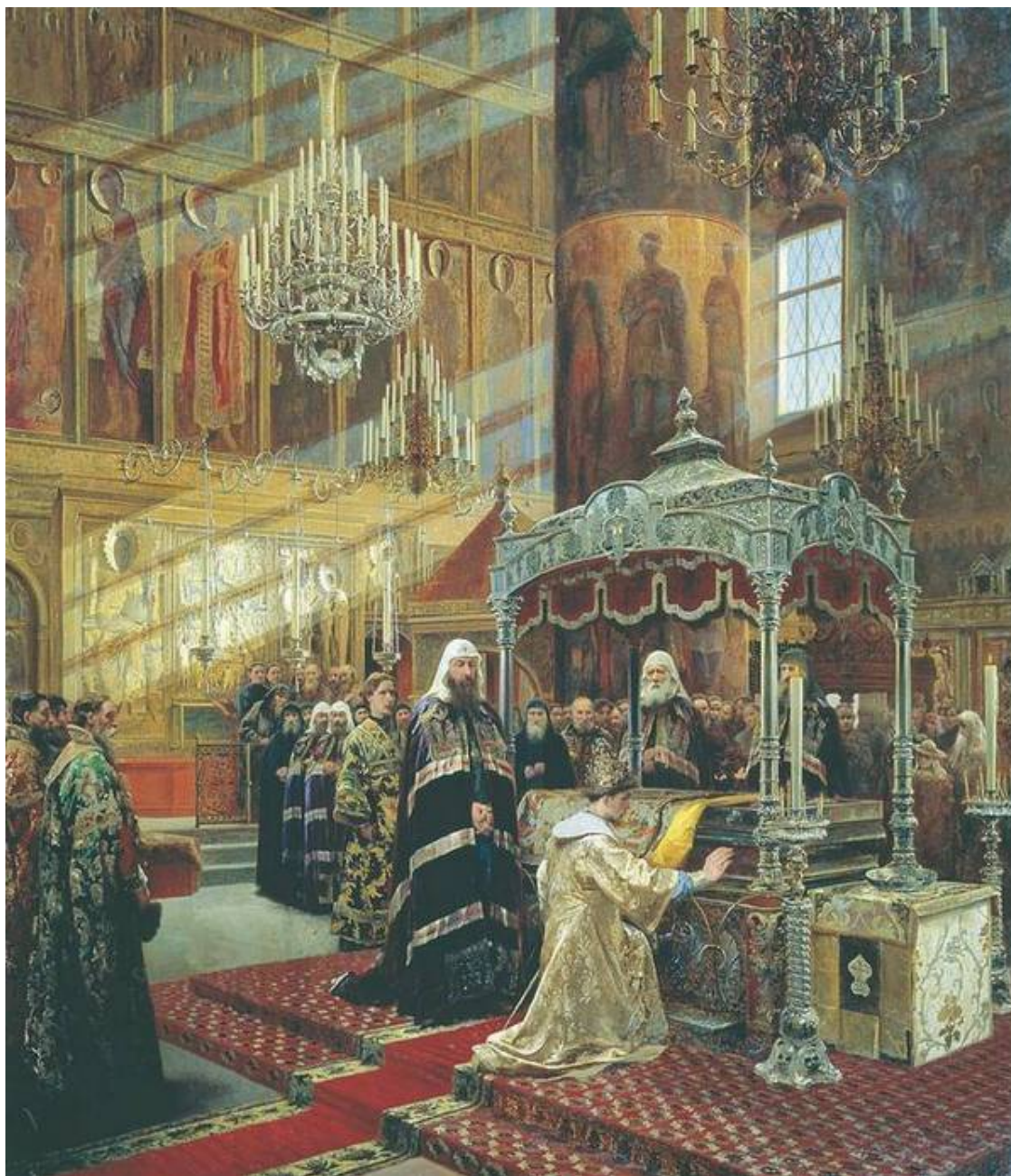
Царь Алексей Михайлович и Никон у гроба святого Филиппа. С картины Александра Литовченко

православных. Им казалось, что вводится какая-то новая, «нерусская» вера. В результате люди одной веры раскололись на два непримиримых лагеря заклятых врагов: сторонников реформ и приверженцев старых обрядов – старообрядцев, которых власти называли раскольниками. Всякое сопротивление никонианству, то есть официальной церкви, рассматривалось как преступление и жестоко каралось. Старообрядцев преследовали, унижали, убивали, а они, гордые своей преданностью вере отцов и дедов, уходили в леса, основывали там «скиты», в которых сжигали себя при попытке их арестовать.