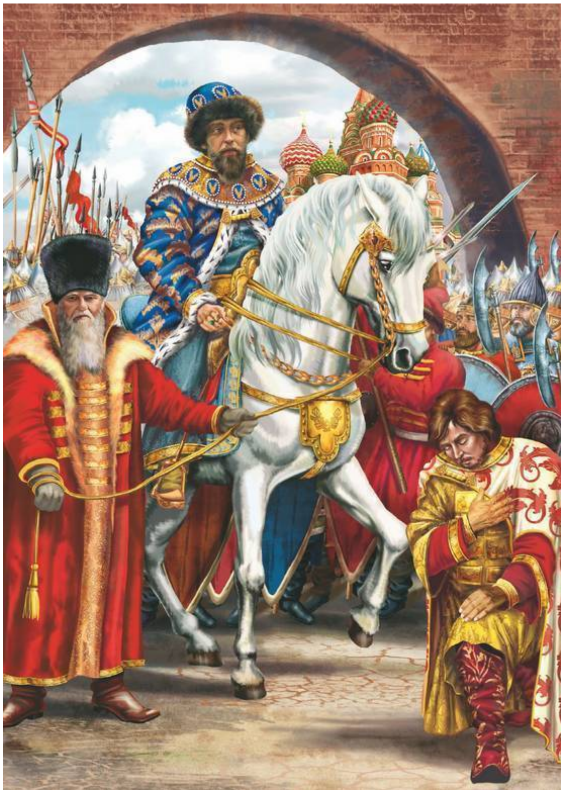
Возвращение патриарха Филарета из польского плена

Прежде всего Филарет постарался упрочить положение новой династии, женив Михаила. В невестах долго ходила Марья Хлопова. Обычно вокруг выбора невесты кипела борьба – ведь родственники царицы взлетали очень высоко. Марью, как-то раз переувсю сластей и оттого заболевшую, оговорили перед царем – сказали, что она неизлечимо больна. Михаил тотчас отказался от невесты. Тогда из множества девиц была выбрана Марья Долгорукая, но через