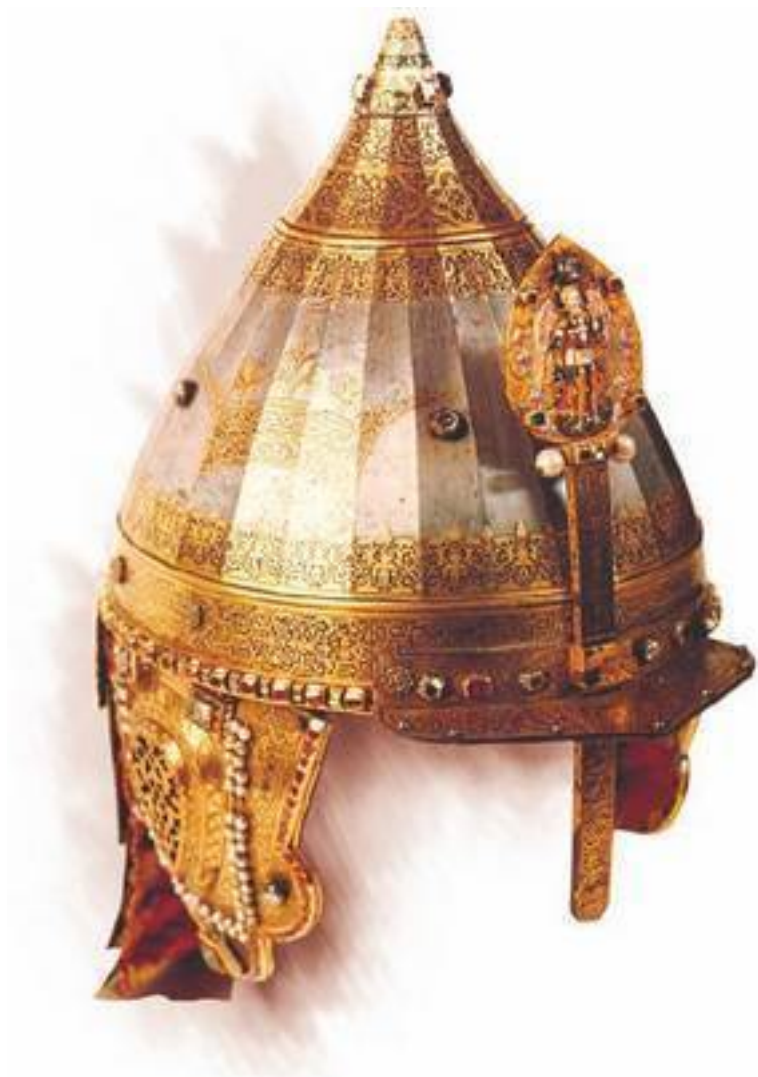
Шлем Михаила Федоровича

Юный царь поначалу правил не самостоятельно – за него все решала Боярская дума, за спиной неопытного Михаила стояли родственники. Все ждали возвращения отца царя, патриарха Филарета (Федора Романова), сидевшего в польском плену. Когда он в 1619 году прибыл в Москву, Михаил встретил отца при въезде в город, стоя на коленях. Филарет был человеком сильным, волевым. До самой его смерти отец и сын «правили нераздельно». Опыта и ума в делах Филарету было не занимать, он прожил тяжелую, полную испытаний жизнь. А задачи перед ним стояли сложные – страна была бедна, беззащитна перед многочисленными врагами, и от умения власти договориться со своими подданными и иностранными государями зависело будущее России.