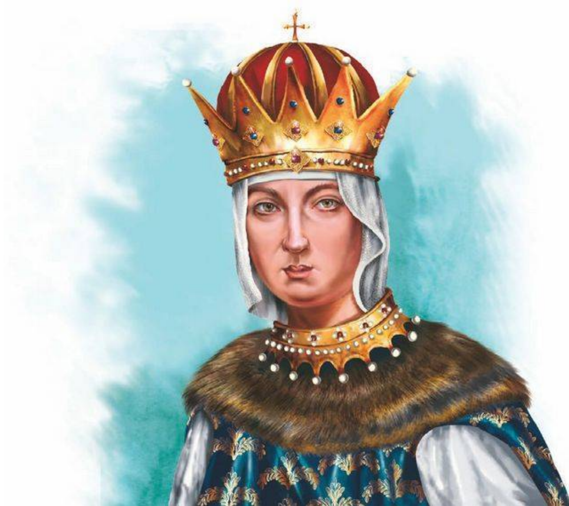
Мария Ильинична Милославская