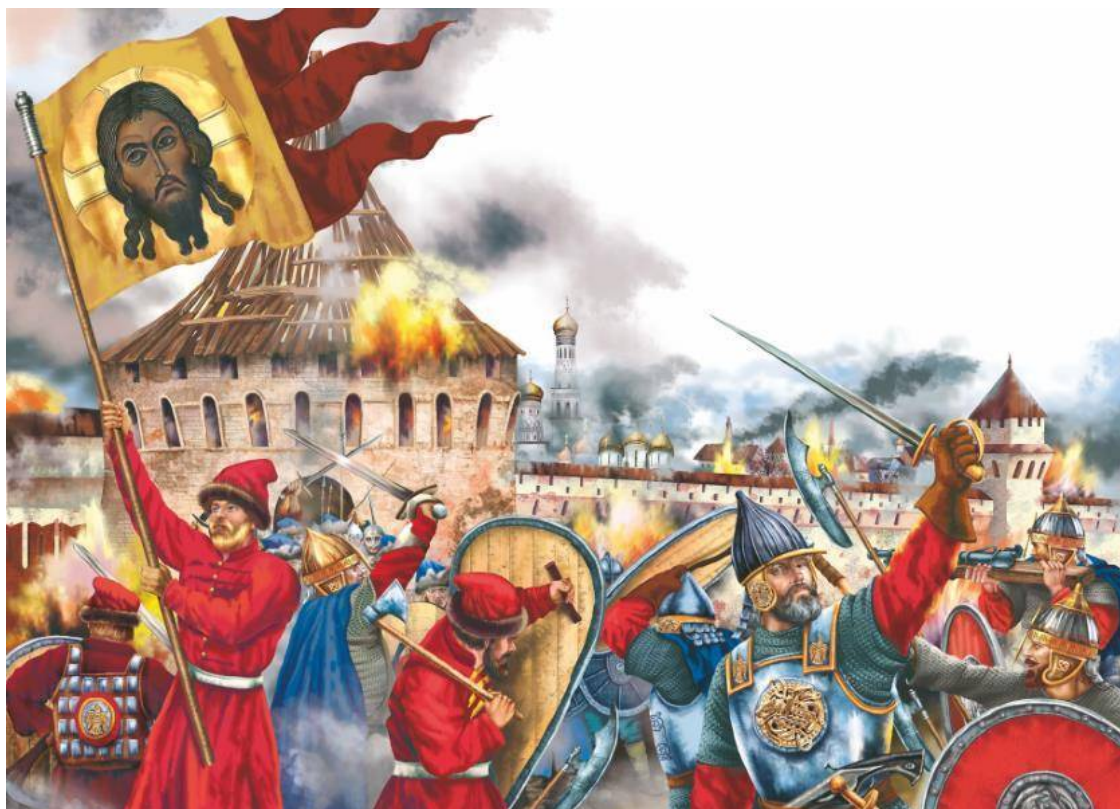
Заканчивалось Смутное время

В Оружейной палате Кремля среди сказочных сокровищ московских царей хранятся две простые, неказистые сабли. У одной даже надломлена рукоять. Но эти сабли – одна из самых бесценных реликвий России. Это боевое оружие спасителей Отечества, Минина и Пожарского. В 1612 году мясник из Нижнего Новгорода Козьма Минин призвал народ встать на борьбу с польскими оккупантами, создать войско – народное ополчение. Его возглавил опытный воин князь Дмитрий Пожарский, и осенью этого года ополчение очистило Москву и Россию от поляков. Затем на Земском соборе – собрании представителей всех русских земель – царем избрали 16-летнего Михаила Федоровича Романова, ставшего первым царем из династии Романовых.