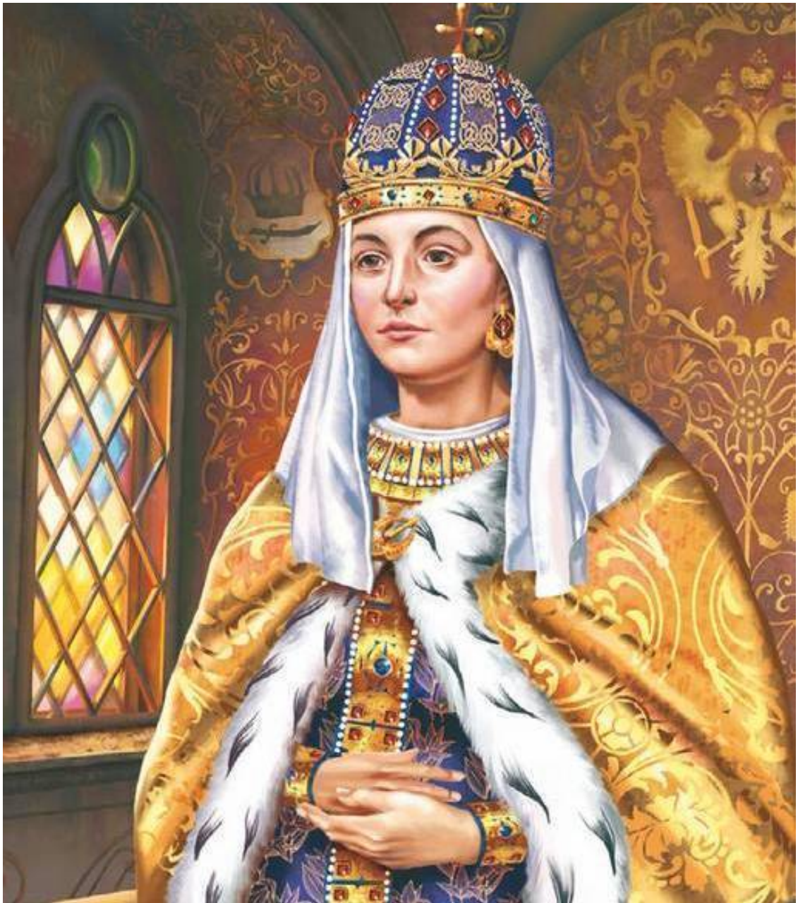
Евдокия Лукьяновна Стрешнева – жена царя Михаила и мать Алексея

При Михаиле в Москву стали приезжать иностранные посольства. Внутри страны новому правительству удалось победить шайки казаков, восстановить деятельность приказов – центральных учреждений, наладить сбор налогов. Словом, при первом Романове жизнь в стране вошла в нормальное русло.