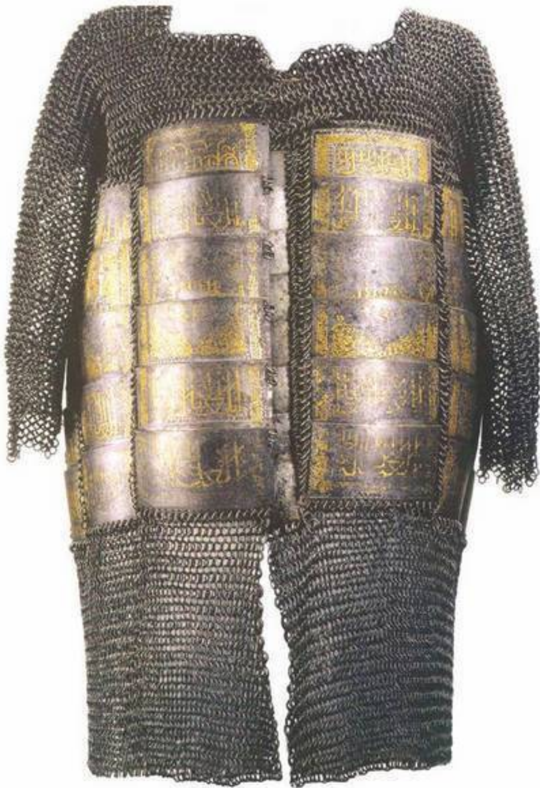
Походная кольчуга Алексея Михайловича

Алексей Михайлович был очень благочестив, глубоко верил в Бога. Он мечтал сделать Москву центром православия и поэтому поддержал намерение патриарха Никона провести церковную реформу. Властный и горячий, Никон круто взялся за реформу. Креститься отныне следовало не двумя перстами, а тремя. Богослужebные книги переписывались заново, так как в них за многие века по вине переписчиков вкрались ошибки. Реформы Никона испугали многих