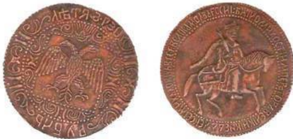
1 рубль при Алексее Михайловиче

зов ввел высокий налог на соль. Во время Соляного бунта народ громил дома вельмож, а жизнь боярина буквально вымолил у толпы сам царь.