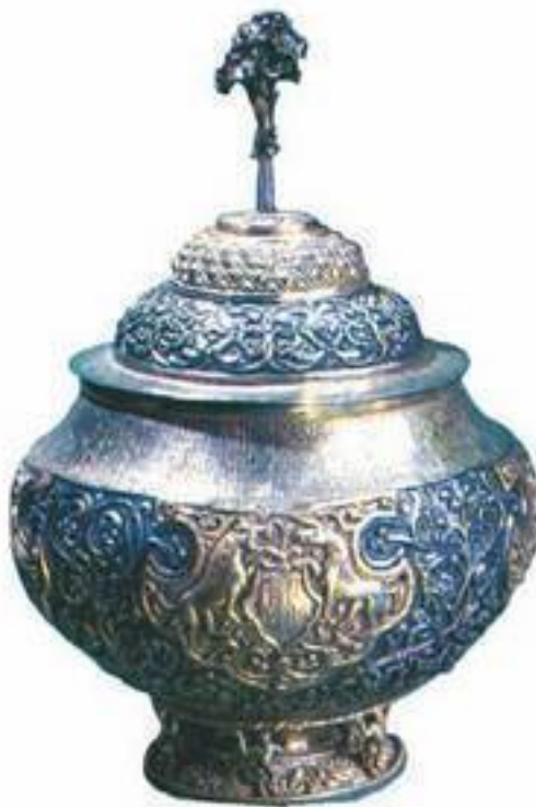
Братина (чаши) Михаила Федоровича