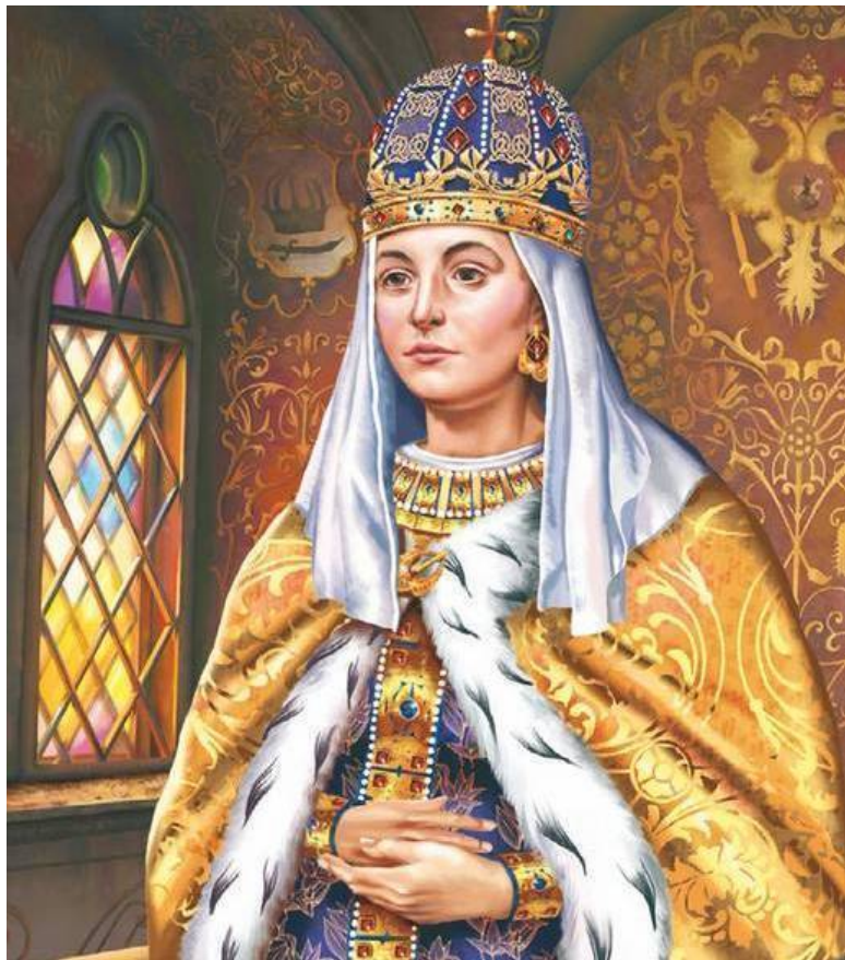
Евдокия Лукьяновна Стрешнева – жена царя Михаила и мать Алексея