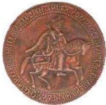
1 рубль при Алексее Михайловиче