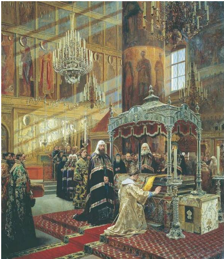
Царь Алексей Михайлович и Никон у гроба святого Филиппа. С картины Александра Литовченко