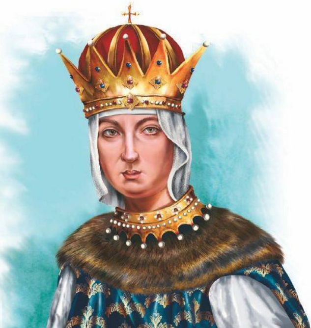
Мария Ильинична Милославская