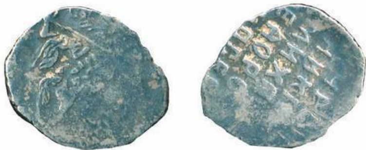
Русская старинная монета «чеушуйка» времен Михаила Федоровича

Прежде всего Филарет постарался упрочить положение новой династии, женив Михаила. В невестах долго ходила Марья Хлопова. Обычно вокруг выбора невесты кипела борьба – ведь родственники царицы взлетали очень высоко. Марью, как-то раз переевшую сластей и оттого заболевшую, оговорили перед царем – сказали, что она неизлечимо больна. Михаил тотчас отказался от невесты. Тогда из множества девиц была выбрана Марья Долгорукая, но через год юная царица умерла – кто-то из зависти отравил ее. В 1626 году Михаил сыграл пышную свадьбу с Евдокией Лукьяновной Стрешневой, красивой, но незнатной дворянской дочерью, которая и родила ему сына Алексея – будущего царя.