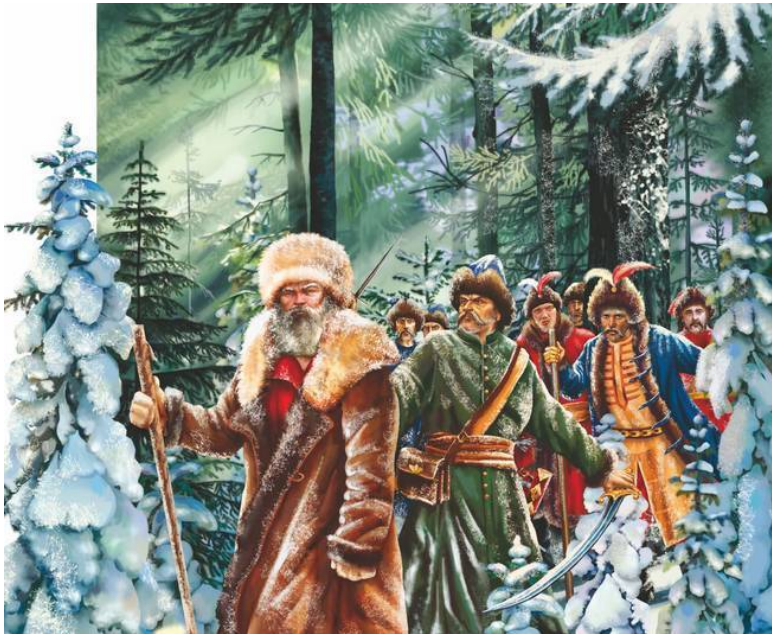
Подвиг Ивана Сусанина