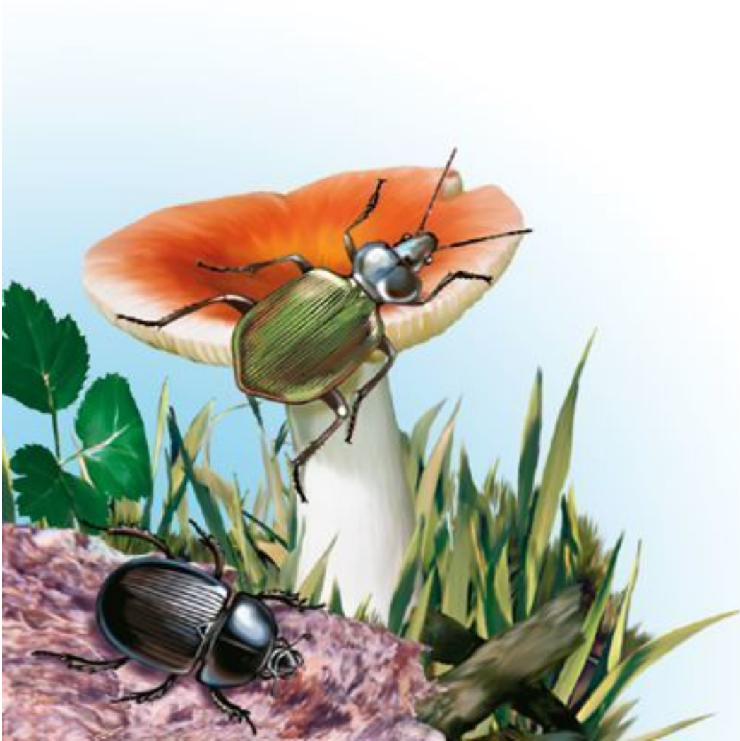
Жужелица (вверху) и навозный жук

Для поимки жука возьмем плоскую тарелку, найдем прозрачную банку, чтобы посадить жука на тарелку и прикрыть перевернутой банкой. Теперь он нам хорошо виден. Хотя пленник явно недоволен, краткое пребывание в плену ему не повредит. Рассмотрим его получше.