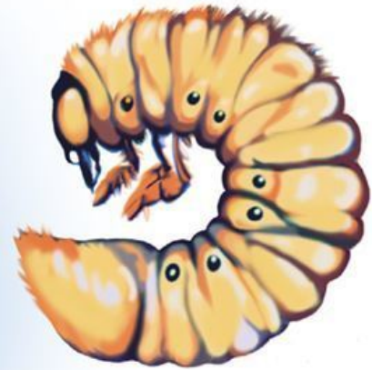
Личинка майского жука

Впрочем, гусеница (личинка бабочек) имеет обычно либо восемь, либо пять пар ножек. Первые три пары не вполне развиты (они укорочены), это и есть шесть ног будущей бабочки; остальные – так называемые ложные ножки. Спереди у гусеницы настоящие ноги с коготками. А в задней части тела – особые выросты, работающие как щипчики. Гусеницы – растительноядные существа, они сидят на листьях, ветках, без этих вспомогательных щипчиков им было бы трудно удержаться. У бабочек, которые появятся потом из этих гусениц, ложные ножки исчезнут. Личинки многих жуков развиваются в почве или под корой деревьев, в древесине. Им не надо удерживаться за качающиеся на ветру листья и ветки, у них нет ложных ножек, а только шесть настоящих. Личинки некоторых жуков могут иметь укороченные шесть ног, а бывают и совсем безногими.