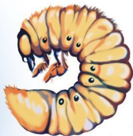
Личинка майского жука

Впрочем, гусеница (личинка бабочек) имеет обычно либо восемь, либо пять пар ножек. Первые три пары не вполне развиты (они укорочены), это и есть шесть ног будущей бабочки; остальные – так называемые ложные ножки. Спереди у гусеницы настоящие ноги с коготками. А в задней части тела – особые выросты, работающие как щипчики. Гусеницы – растительноядные существа, они сидят на листьях, ветках, без этих вспомогательных щипчиков им было бы трудно удержаться. У бабочек, которые появятся потом из этих гусениц, ложные ножки исчезнут. Личинки многих жуков развиваются в почве или под корой деревьев, в древесине. Им не надо удерживаться за качающиеся на ветру листья и ветки,