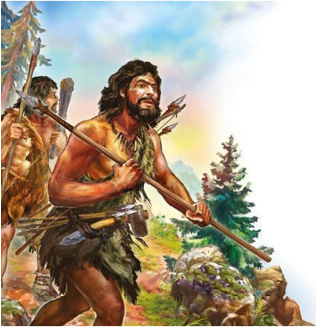
Так выглядел кроманьонский охотник. Оружие его – копье и каменный нож