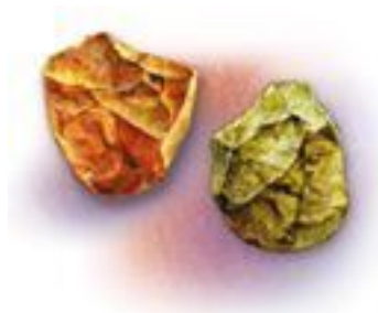
Галька, расколота два миллиона лет назад, – орудие предка человека

Скорее всего, этот древний человек был убит в бою. Рядом с ним лежало оружие: боевой топор, нож, большой лук и колчан со стрелами. Найти в столь хорошем состоянии оружие более чем пятидесятилетней давности (у ножа сохранились даже деревянная рукоятка и плетеные ножны) было огромной удачей ученых. Но и оно далеко не самое древнее. Холодное оружие появилось задолго до рождения таинственного Эци.