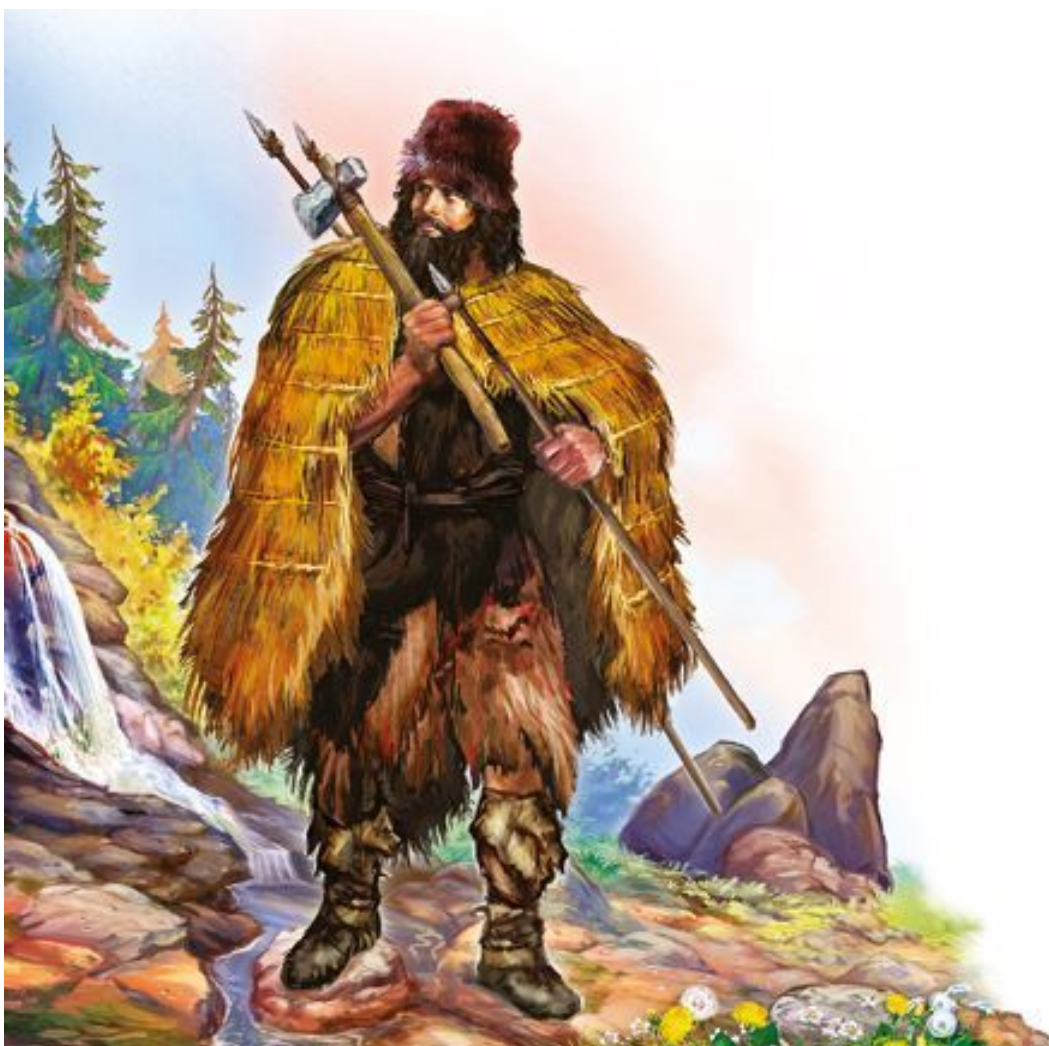
Так выглядел Эци более пяти тысяч лет назад

Исследования показали, что Эци жил более 5300 лет назад, что скончался он в возрасте лет пятидесяти, для того времени, можно сказать, стариком. По останкам удалось восстановить прижизненный облик Эци. А так как одежда, бывшая на нем, неплохо сохранилась, то художники смогли даже изваять его скульптуру.