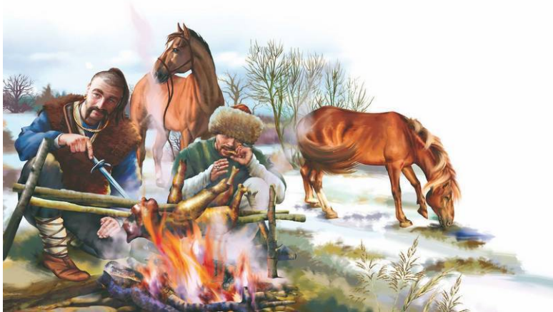
Святослав на привале