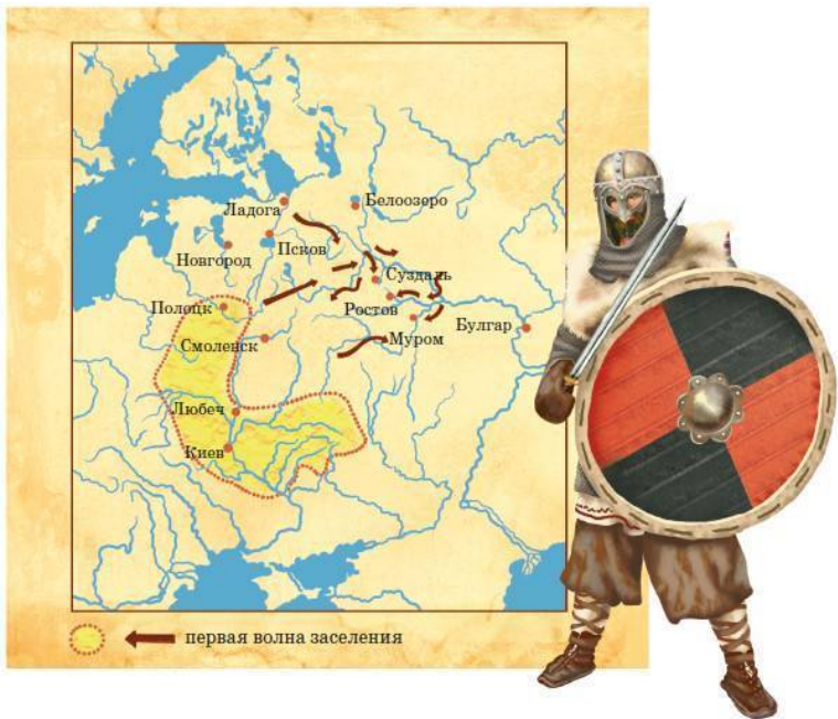
Государство Русь к первой половине IX в. Древний варяжский воин