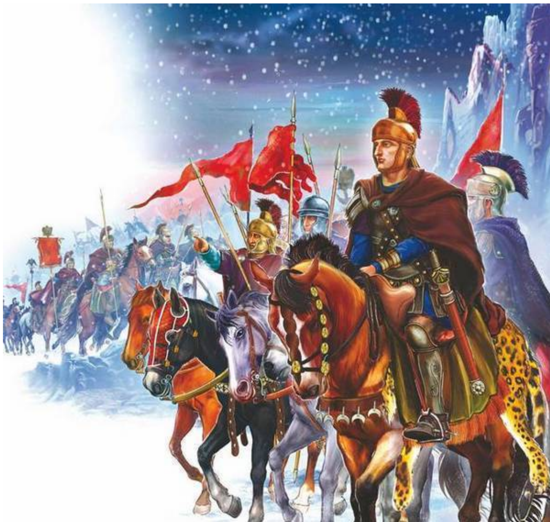
Константин I Великий во главе войска

28 октября 312 г. армия Максенция была наголову разбита у Мульвийского моста, сам полководец погиб, утонув в реке Тибр, а Константин торжественно вступил в Рим. По словам одного современника, умеренность и справедливость были отличительными качествами Константина. Всем сторонникам Максенция он оставил имущество и принял их в число своих друзей. Пробыв недолгое время в Риме, он отправился в Медиолан (Милан), навстречу Лицинию, где оба императора издали эдикт, окончательно положивший конец гонениям на христианство. В эдикте говорилось: «Руководствуясь здравым и правым смыслом, мы объявляем следующее наше решение: никому не запрещается свободно избирать и соблюдать христианскую веру и каждому даруется свобода обратить свою мысль к той вере, которая, по его мнению, ему подходит». Миланский эдикт был в сущности декларацией о веротерпимости и равенстве перед государством всех религий, как старых, так и новых. Это была еще не победа христианства в Римской империи, но ее предчувствие и приготовление. Когда равенство объявлено для всех верований, то, естественно, главенствующее положение занимает та религиозная община, которая наиболее многочисленна и хорошо организована. К началу IV в. христианская Церковь, пройдя череду жестоких гонений, достаточно окрепла; она теперь имела очень четкую и жесткую структуру в виде епархий почти во всех римских провинциях, имела своих представителей в армии и органах власти, а также обладала немалыми финансовыми средствами.