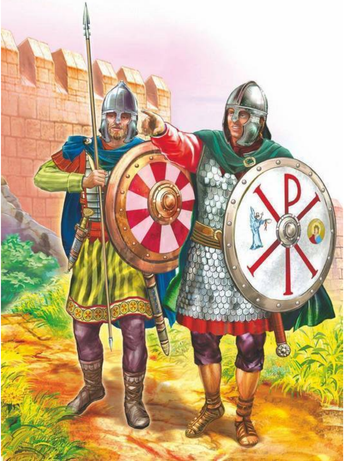
Воины Константина I (IV в.)

Поддержка Церкви требовалась Константину в преддверии предстоящей жестокой войны. После того как в Римской империи осталось только два властелина – Константин и Лициний, соперничество между ними стало неизбежным и грозило перерасти в вооруженное столкновение. В 314 г. началась междоусобная война. После нескольких кровопролитных сра-