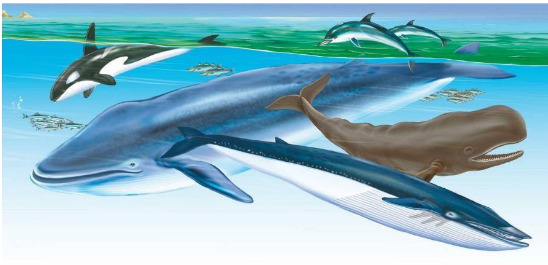
Косатка. Синий кит. Дельфины. Кашалот. Финвал.

Киты тоже разделяются на две группы. Одни киты при переходе к жизни в водной среде сохранили зубы и составляют группу зубатых китов – это кашалоты, косатки, дельфины. Другие зубы потеряли, вместо них выросли особые пластины – китовые усы, сквозь которые кит цедит захваченную в огромную пасть массу воды, при этом все живое – мельчайшие рачки, стаи рыбешек, оставшиеся в его пасти, – составляет его пищу. Огромный синий кит, например, достигающий длины 30 метров и массы в 130 тонн, полностью приспособлен к питанию крохотными морскими рачками, которые, правда, в море сосредоточиваются в стаи из сотен тысяч особей. Так же ведет себя и финвал, захватывающий в свой цедильный аппарат целые стаи сельди, мойвы, других мелких рыб.