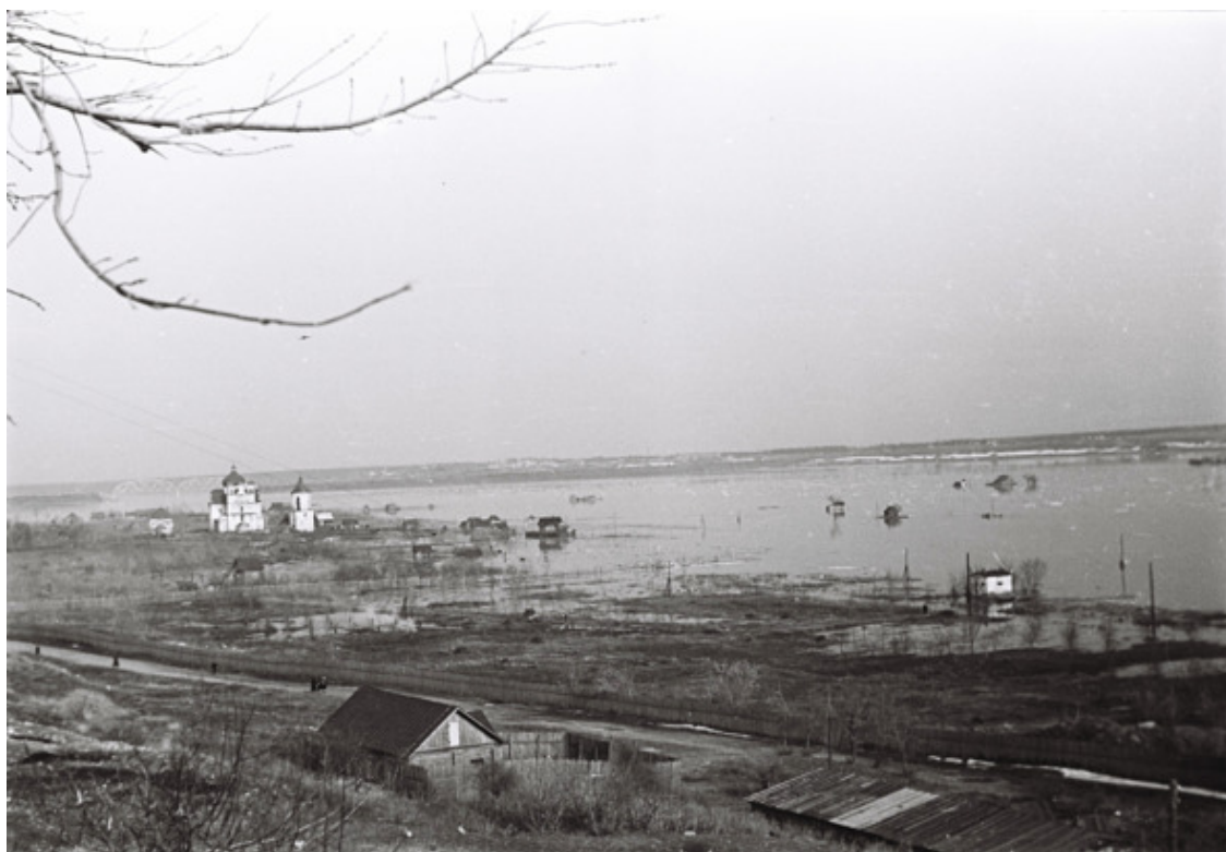
Паводка 1955 году

Вяртаючыся да межаў, скажу, што паўночнай жа мяжой я сабе меў мост праз чыгунку перад вакзалам. Вось так, ад Валу да вакзалу па Першамайскай, дзесьці два кіламетры былі маёй тэрыторыяй, якая мною была добра выведана, бо на пачатку пяцідзясятых большасць «маёй» тэрыторыі была прыватным сэктарам ды часткова адноўленымі будынкамі, з лапікавымі гародчыкамі у дварах, з разнамаснымі хлявочкамі, прыбіральнямі, з дзіркамі ў платах. Некалькі вялікіх дамоў у цэнтры гораду мелі чамусьці свае імёны, прыкладам Дом Леніна – ля першай школы, Дом Будзённага – ля кіно «Радзіма», Шэры Дом – на пачатку вуліцы Чалюскінцаў, Зялёны Дом — Ленінская 68, дзе жылі мае аднакашнікі, бацькі якіх служылі ў Школе КГБ, Дом Саветаў, на Першамайскай Дом 90, Дом Сталіна. Апошні і зараз, праўда падрощаны на адзін паверх, стаіць як і ранней.