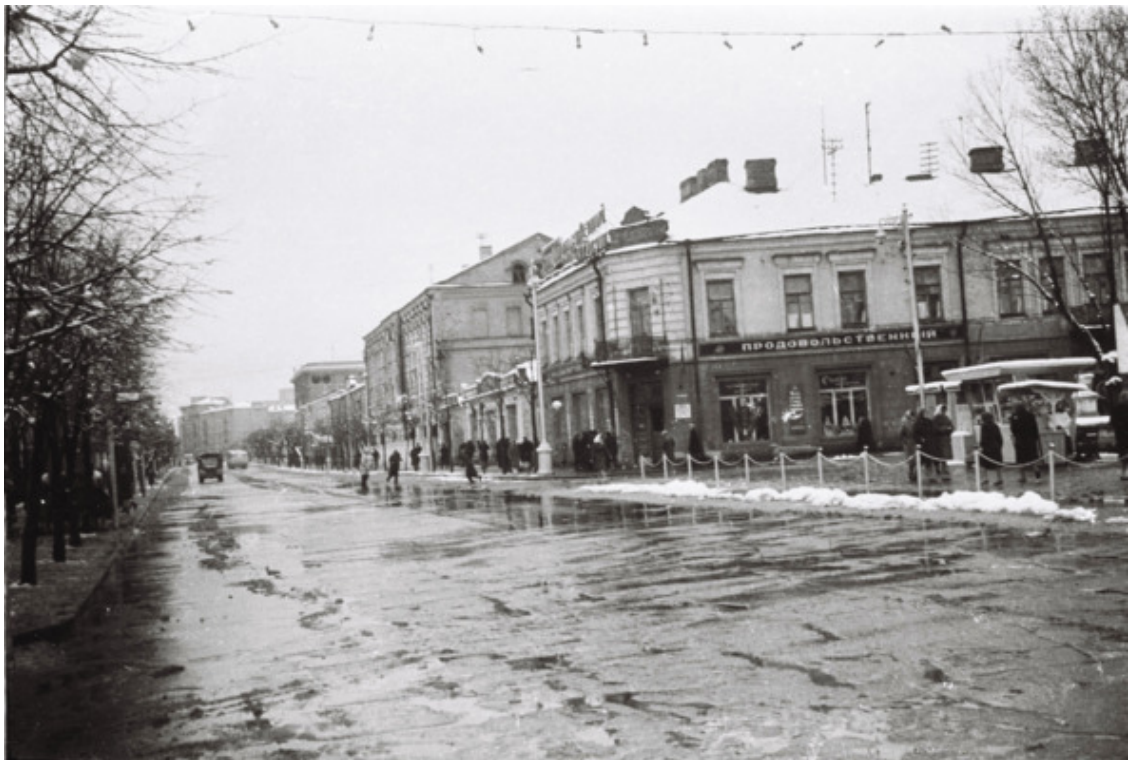
Дом маленства і юнацтва

На той жа час крама на першым паверсе, працуючы з рана да поўначы, прапанавала ікру чорную ды чырвоную ці ў слоіках, ці то нўпрост з бочкі, а бляшанкі з крабамі ды з вантробамі траскі нават іржа прыхоплівала, але куплялі людзі больш ліверныя каўбасы, салёную рыбу, абаранкі, і, як прысмакі, цукеркі. Ды найбольш хадавыя былі «падушачкі» з павідлам у сярэдзіне.