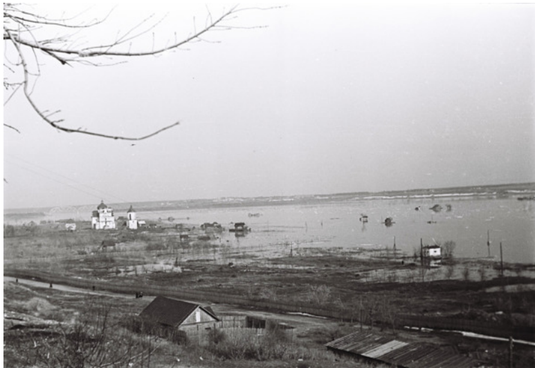
Паводка 1955 году

Вяртаючыся да межаў, скажу, што паўночнай жа мяжой я сабе меў мост праз чыгунку перад вакзалам. Вось так, ад Валу да вакзалу па Першамайскай, дзесьці два кіламетры былі маёй тэрыторыяй, якая мною была добра выведана, бо на пачатку пяцідзясятых большасць «маёй» тэрыторыі была прыватным сэктарам ды часткова адноўленымі будынкамі, з лапікавымі гародчыкамі у дварах, з разнамаснымі хлявочкамі, прыбіральнямі, з дзіркамі ў платах. Некалькі вялікіх дамоў у цэнтры гораду мелі чамусьці свае імёны, прыкладам Дом Леніна – ля першай школы, Дом Будзённага – ля кіно «Рад-