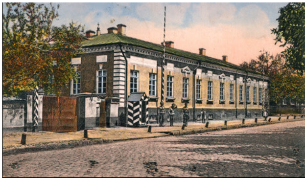
Дворец Александра в Таганроге