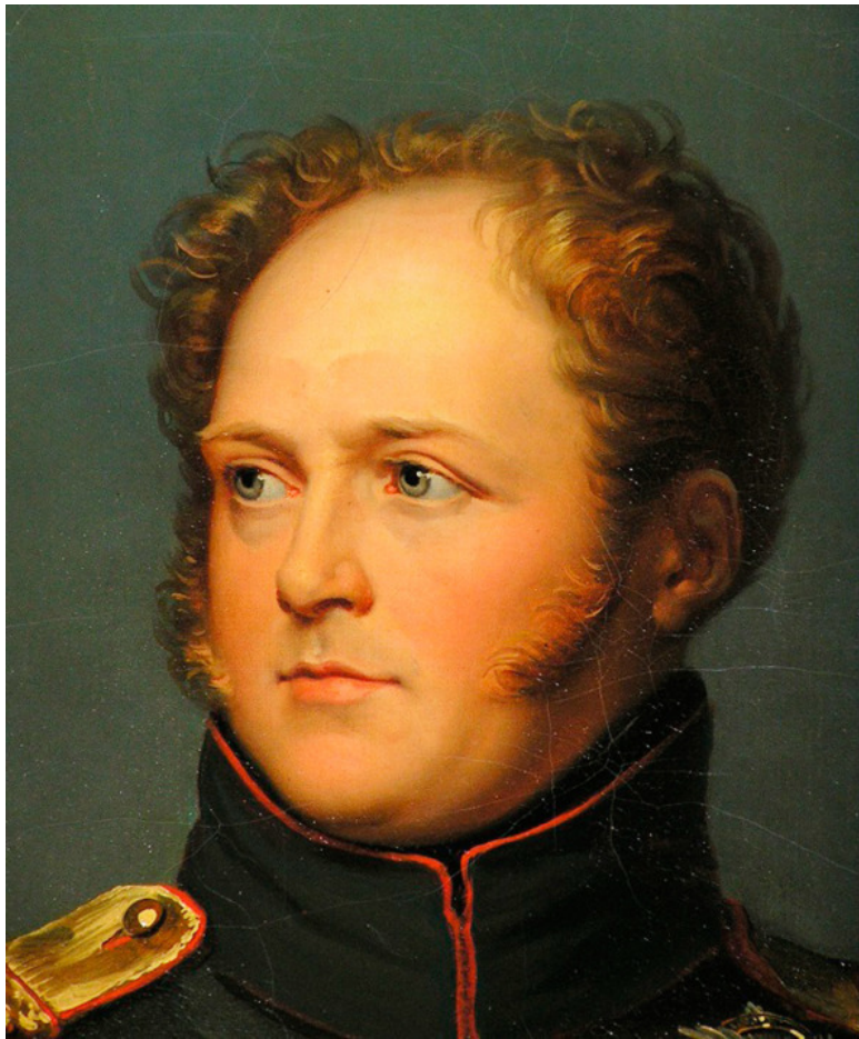
Император Александр Первый