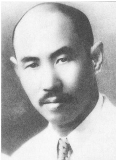
Ван Сянчжай (1885—1963) – основатель Ицюань (Дачэнцюань)

Ван Сянчжай (1885—1963), известный также под именами Нибао, Чжэнхэ, Юйсэн, был одним из самых выдающихся учеников прославленного мастера внутреннего стиля Синьицюань – Го Юньшэня. Считается, что только Вану, который стал учеником Го, когда тот был уже в преклонном возрасте, он передал все секреты упражнений Чжан Чжуан. Позже они стали одним из наиболее характерных элементов Ицюань.