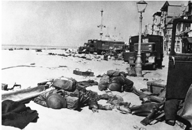
Дюнкерк через объектив немецкой фотокамеры