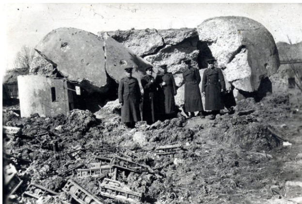
Советские офицеры позируют на фоне «карельской скульптуры». Апрель 1940 г.

К числу плюсов в боевой подготовке войск, после столь суровой школы, является упразднение института политических комиссаров, опыт прорыва долговременных укреплений, зимней войны в целом, а также возвращение в производство пистолета-пулемета (ППД, ППШ). Минусы, помимо тяжелейших потерь – потеря хоть какого-то престижа на мировой арене. Германское правительство понимает, что вполне способно добиться всестороннего успеха в войне против «колосса на глиняных ногах». Взгляд выжившего советского солдата в фотокамеру. На руинах финского дота, весна 1940 г.