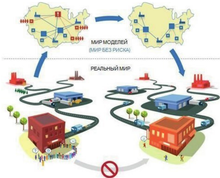
Рис. 1.1. Моделирование реальных систем

Все этапы разработки модели – проекция реального мира в мир моделей, выбор уровня абстракции и выбор языка моделирования менее стандартизированы, чем процесс использования моделей для решения задач. Моделирование до сих пор больше искусство, чем наука.