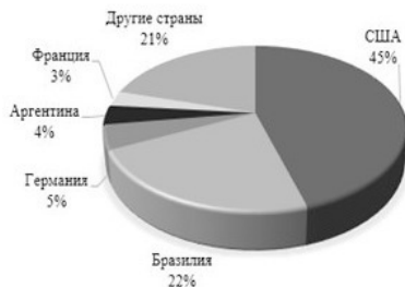
Рисунок 1.1 – Структура производства биотоплива по странам

Структура производства биотоплива по основным странам представлена на рисунке ниже.