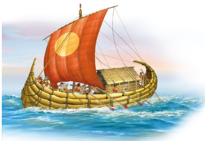
Папирусное судно древних египтян

А ковчег Ноев был, как считают некоторые исследователи Библии, не таким уж и большим: около 156 метров в длину, 26 метров в ширину и 16 метров в высоту. Корабль «Титаник», например, был длиной 270 метров. Но главное в этой истории то, что люди теперь знали: лодки можно не только выдалбливать, но и строить. Эскимосы, индейцы и островитяне Тихого океана так и стали поступать. Они сначала изготавливали деревянный «скелет» – каркас, а уже потом обтягивали его шкурами или корой деревьев. Каяки, каноэ и катамараны стали гораздо легче и лучше.