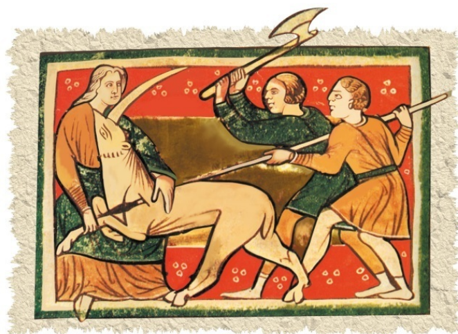
Средневековая миниатюра «Единорог и охотники»

Основными поставщиками рогов единорога в XV–XVII веках были норвежские и датские купцы. Как-то в руках у одного лавочника из Копенгагена оказался не просто рог, а целый череп животного с торчащим из него отростком. Заинтересовавшись, он пригласил натуралиста Оле Ворма, чтобы тот провел исследование. Ученый-зоолог тщательно изучил и обмерил череп и пришел к поразительному выводу. Череп принадлежал какому-то неизвестному китообразному, а «рог единорога» был его видоизмененным зубом! Свое открытие Оле Ворм опубликовал в 1638 году, причем поместил в книгу как рисунок обследованного черепа с рогом, так и изображение предполагаемого хозяина, назвав его unicornu marinum – единорог морской.