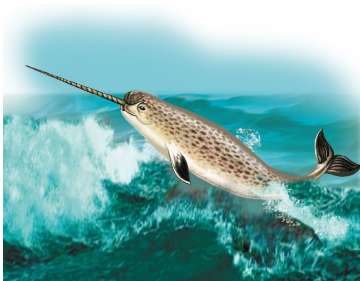
Редкое китообразное нарвал. Именно его бивень так долго и выдавали за рог мифологического единорога

Основными поставщиками рогов единорога в XV–XVII веках были норвежские и датские купцы. Как-то в руках у одного лавочника из Копенгагена оказался не просто рог, а целый череп животного с торчащим из него отростком. Заинтересовавшись, он пригласил натуралиста Оле Ворма, чтобы тот провел исследование. Ученый-зоолог тщательно изучил и обмерил череп и пришел к поразительному выводу. Череп принадлежал какому-то неизвестному китообразному, а «рог единорога» был его видоизмененным зубом! Свое открытие Оле Ворм опубликовал в 1638 году, причем поместил в книгу как рисунок обследованного черепа с рогом, так и изображение предполагаемого хозяина, назвав его unicornu marinum – единорог морской.