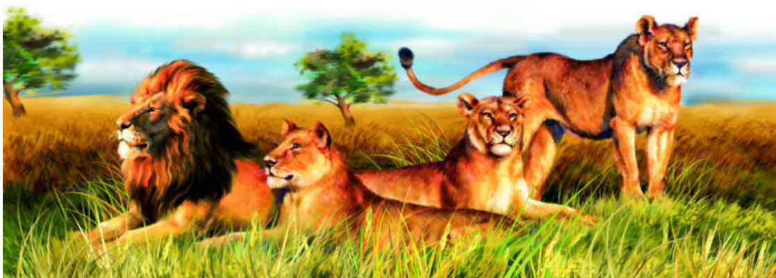
Семья львов называется прайдом

Современные хищники довольствуются менее защищенной добычей, и клыки у них не такие гигантские. В современном мире сходные экологические ниши занимают львы, тигры, леопарды, гепарды и снежные барсы. Теперь внимание! Все эти крупные хищники относятся к семейству Кошачьих. Название говорит само за себя. Сразу становится понятным, что наши мурки и барсики являются дальними родственниками настоящих серьезных хищников, которых побаивается даже человек.