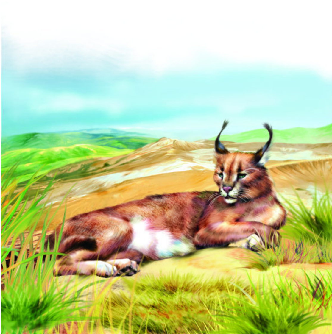
У каракала уши с кисточками, как у рыси

В Америке свои кошки. Например, пампасовая. Встречается не только на покрытых травой равнинах, но также в лесах и высокогорьях. На территории Боливии, Аргентины, Бразилии и Парагвая встречается кошка Жофруа. Так ее назвали в честь французского натуралиста Жофруа Сент-Илера, путешествовавшего по Южной Америке в XIX в. Эта кошка не только прекрасно лазает по деревьям, но и плавает; умеет ловить рыбу.