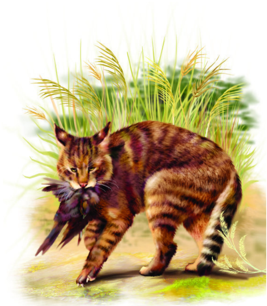
Хаус – камышовый кот

В Монголии обитает кот манул. В XVIII в. он был описан путешественником Питером Палассом, поэтому манула называют иначе палассовым котом. Он не приспособлен к быстрому бегу, поэтому в открытых степях практически истреблен, сохранился лишь в предгорьях. мех у манула густой, наиболее пушистый среди всех представителей рода Felis . На 1 квадратном сантиметре спины расположено до 9000 волос. В такой шубе никакие холода не страшны!