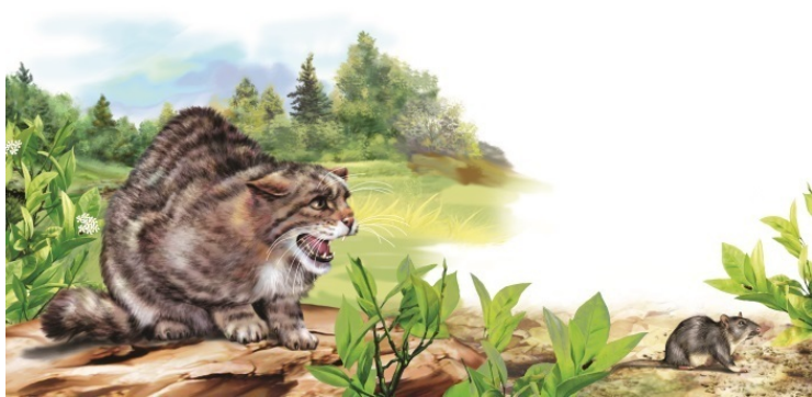
Лесная шотландская кошка

С их великорослыми собратьями кошек роднит способ охоты. Как пишут в серьезных справочниках, «кошачьи – наиболее специализированные из всех хищных, всецело приспособленные к добыванию животной пищи преимущественно путем скрадывания, подкарауливания и реже – преследования своих жертв». Когда в домашней кошке просыпаются древние инстинкты и она начинает подбираться к ничего не подозревающим голубям – это и есть скрадывание. Мысленно увеличьте кошку в несколько раз – и получите точную картину охотящейся львицы или леопарда. Различие лишь в размерах.