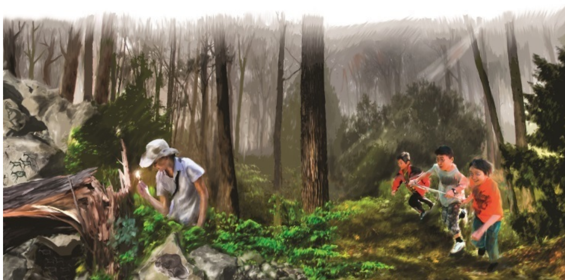
Может быть, эта лесная пещера хранит в себе какие-то тайны...

От первобытных охотников нас отделяют многие тысячелетия, поэтому все рассуждения об их нехитрой «магии» – не более чем предположения. Однако сохранились «документы», говорящие в пользу этих предположений.