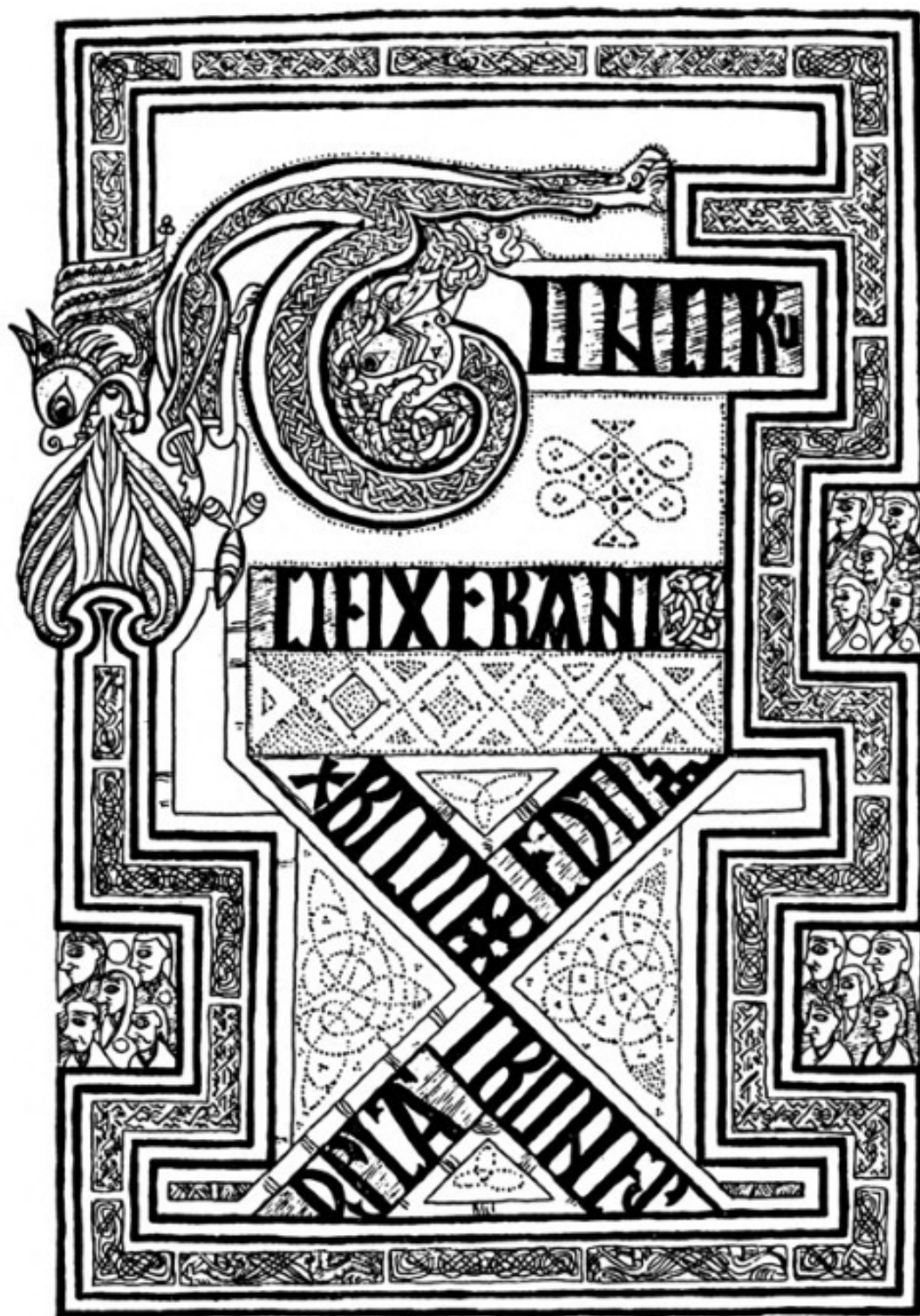
Ил. 3. Келлская книга, страница Тунк (с лат. «тогда») (чернила и золото на пергаменте, Ирландия, около 800 года)