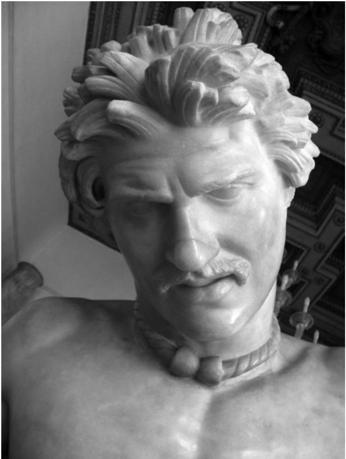
Ил. 2. Умиравший галл (мраморная скульптура, период эллинизма, Турция, I век до н. э.)

Размеры Римской империи просто не укладываются в голову: она занимала всю Северную Африку, Европу и Ближний Восток до самых границ Персии. Через Персию проходили римские дороги. На границе с Китаем также находилось римское торговое поселение. Известно географическое сочинение под названием «Перипл Эритрейского моря» — дневник древнегреческого мореплавателя. Он путешествовал по Индийскому океану на римских кораблях, чей основной торговый путь пролегал из Египта через Красное море и дальше вдоль побережья Африки — к территории современного Мозамбика, на запад и на восток, к югу Аравии