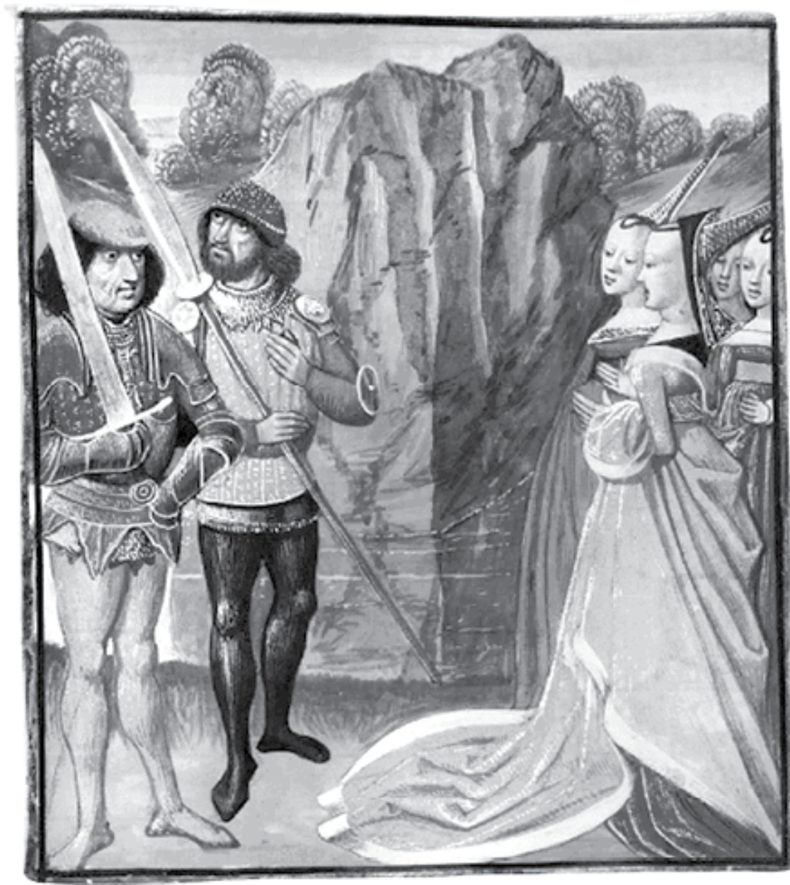
Путь доблести и другие истории. Последняя четверть XV в.

Так в каком возрасте на самом деле вступали в брак в шекспировские времена? XVI век – это уже не Средневековье, конечно, но зато по нему есть достаточно приличная статистика. Минимальный брачный возраст по церковным нормам был 12 лет для девушек и 14 для юношей. Тем, кому кажется, что это страх как мало, напоминаю, что в современной России минимальный брачный возраст – 14 лет. Всего на два года больше во времена Шекспира.