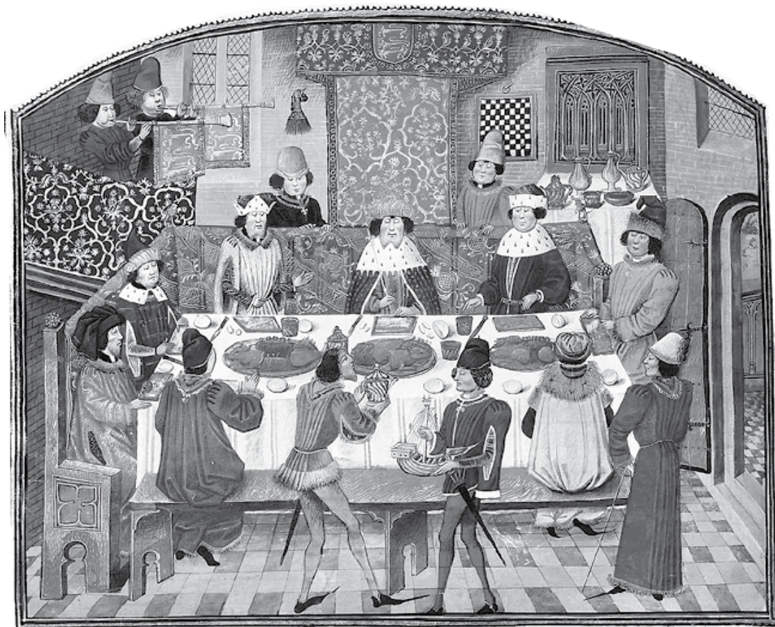
Королевская трапеза. Жан Фруассар. Хроники. Миниатюра XV в.

Для историка эта граница в 60 лет означает, что общество, ее установившее, признавало, что за ней начинается снижение способностей и упадок сил. То есть, пожалуй, именно этот возраст, 60, можно определить в качестве возраста, с которого средневековый человек начинал считать себя старым. Расцвет же сил признавался у людей от 30 до 60 лет, потому что возраст в 30 лет был нижней границей у многих административных и управленческих должностей. Впрочем, монах и впоследствии аббат Джоселин из Бреклонда возражал против двух кандидатур в приоры Бери-Сент-Эдмундс на основании того, что кандидатам всего по 40 лет и они слишком молоды. Но относительно тех, кто занимался тяжелым физическим трудом, средневековой статистики просто нет. Есть, например, Закон о рабочей силе от 1351 года, обозначающий «пенсионным» возрастом 60 лет, после чего работник больше не был ничего никому обязан. Не верьте в «здоровый труд на свежем воздухе»! В современной Европе, снимающей с пенсионеров высокий налог, попытка поднять возраст выхода на пенсию до 67 лет вызвала бурю протестов потому, что средняя продолжительность жизни у разнорабочих и вообще людей физического труда – всего 68 лет. В 2014 году. Так что вполне вероятно, что и в Средние века люди не слишком заживались после достижения заветного рубежа. Это было бы в интересах экономики короны.