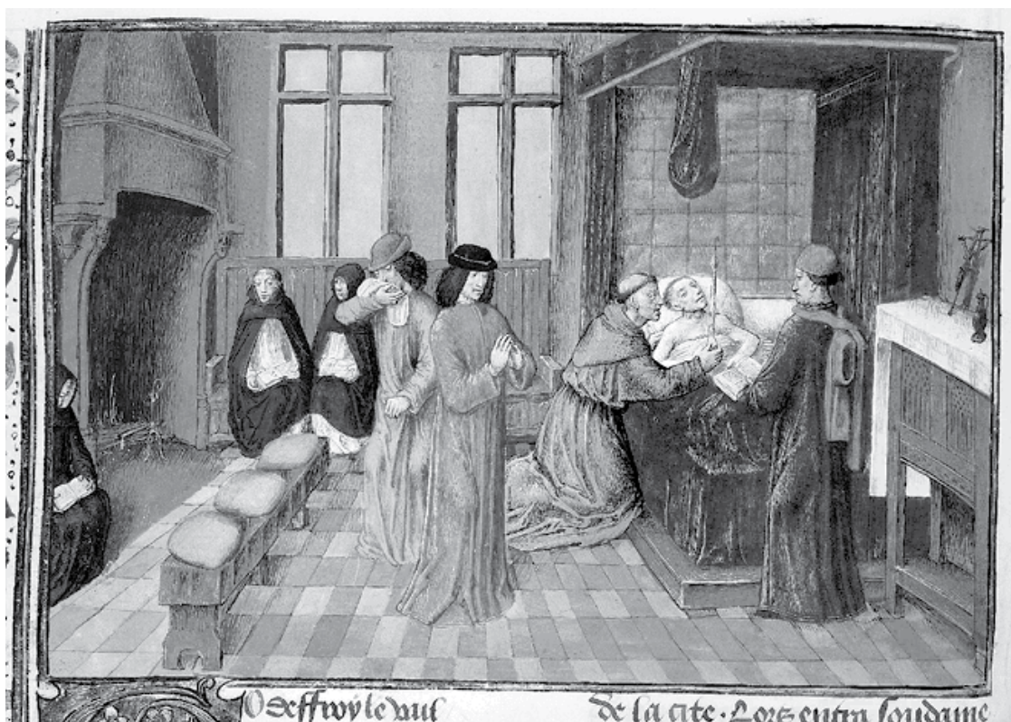
У постели больного. История Крестовых походов. 1479–1480 гг.