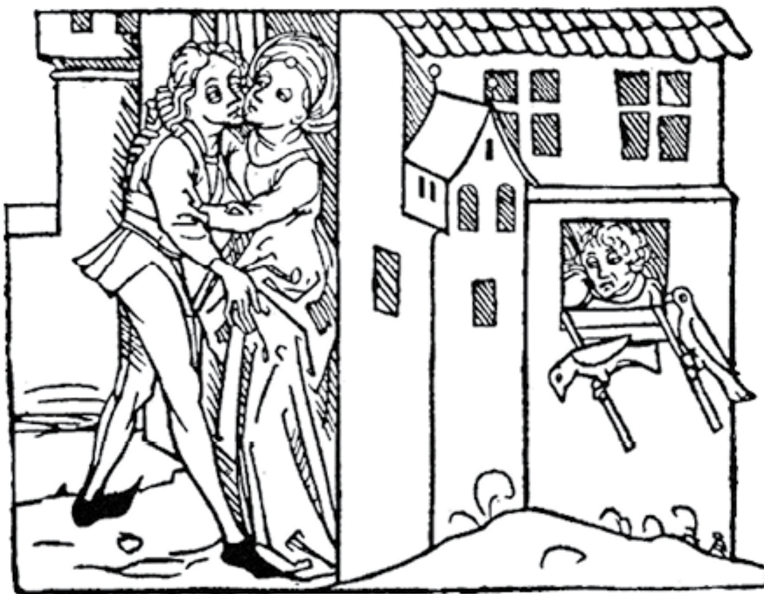
Любовники. Гравюра XVI века со средневековой миниатюры

Генриху было всего 18 лет, когда ему пришлось срочно жениться на испанской принцессе Екатерине, 24-летней вдове его скорпостижно скончавшегося брата. Это было рискованное решение, ведь в глазах Церкви жена брата была все равно что родная сестра, и такой брак можно было оспорить (что Генрих через 24 года и сделал). Но в тот момент никто, естественно, еще не мог предположить, что Екатерина не сможет подарить стране наследника, а возвращать ее уж очень не хотелось. Поэтому Генрих, повинаясь отцовскому приказу, женился, и довольно долго они даже прожили в любви и согласии. Пока не стало ясно, что Екатерина уже немолода, серьезно больна (она сильно растолстела из-за гормонального сбоя) и не может родить ребенка. А Генриху было еще только 35 лет.