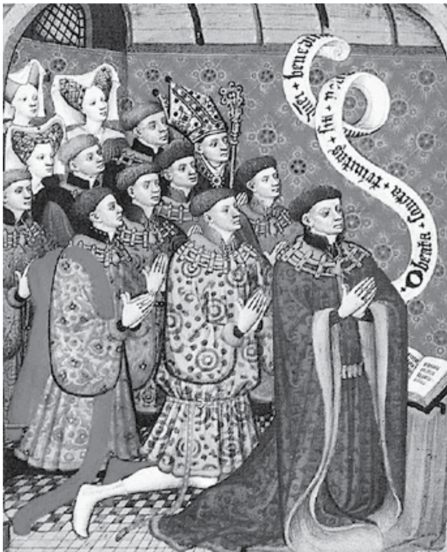
Ральф Невилл и его двенадцать детей. Миниатюра из книги «Livre d'heures de la famille Neville», Мюнхенский мастер Золотой легенды. 1410 г.

Ю.Л. Бессмертный в книге «Жизнь и смерть в Средние века» приводит пример, что во включенном в Парижский статут 1225 года установлении Эда Сюлли специально оговаривается, что священник должен в этом случае миропомазать тех больных, которым исполнилось 40 лет, потому что именно этот возраст считался границей, за которой начинался возраст повышенного риска. «Чуть более конкретно высказывается Филипп Новарский 1 . Как уже говорилось, он называет весь промежуток от 40 до 60 лет «средним возрастом», однако делит его на две неравноценные половины. Возраст от 40 до 50 лет Филипп считает несравненно лучшим, чем от 50 до 60. Ибо от 40 до 50 лет человек может еще в полной мере пользоваться всеми благами и всем «совершенством» «среднего возраста». О возрасте от 50 до 60 лет этого уже сказать нельзя. Когда же исполнится 60 лет, продолжает Филипп, наступает старость; в это время полагается оставлять службу, жить «со своими» и для себя – «если только есть с чего жить».