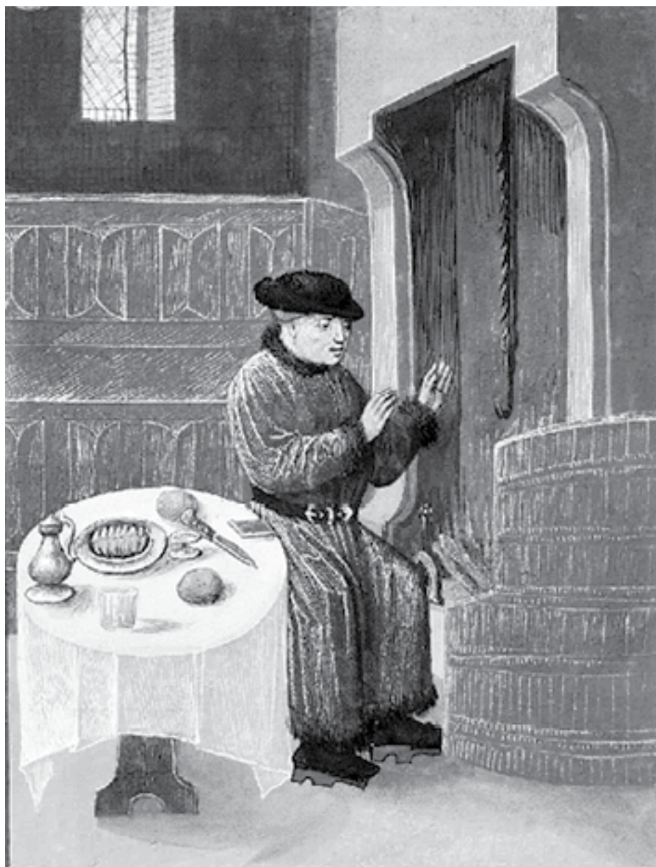
Жан Фуке. Горожанин, греющийся у очага. Миниатюра XV в.

3) Позднее Средневековье (XIV – начало XVI в.). Одновременно пик, вершина Средневековья и в то же время его кризис. В это время все достигает своего абсолюта: рыцари с ног до головы заковываются в броню и сшибают друг друга с коней на турнирах, короли и герцоги играют в рыцарей Круглого стола, дамские головные уборы стремятся вверх, как и шпили готических церквей, модники и модницы носят обувь с длинными носами и многометровые шлейфы. В какой-то степени Средневековье стало сдавать позиции под тяжестью населения – людей стало больше, чем при том уровне знаний можно было прокормить. Поэтому позднее Средневековье началось с Великого голода, продолжилось эпидемиями чумы, крестьянскими войнами, гражданскими войнами, Столетней войной и наконец рухнуло, уступив место набирающему силу Ренессансу, Реформации и Новому времени.