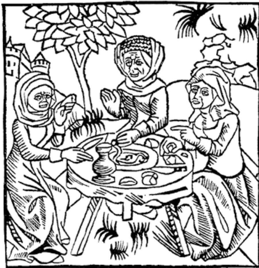
Обед. Гравюра конца XV – начала XVI в.

Откуда взяты эти 36 лет госпожи Лариной, оставим на совести тех, кто это придумал, – у Пушкина нигде не сказано, что она родила Татьяну в 18 лет, скорее наоборот, есть указания, что дети у нее появились далеко не сразу (она успела чуть не развестись с мужем, потом привыкнуть к нему, а про детей все еще ни слова не было). Вернемся лучше к Средним векам, когда, дескать, так и жили: в 12 замуж, а в 18 уже на пенсию, если вообще доживешь.