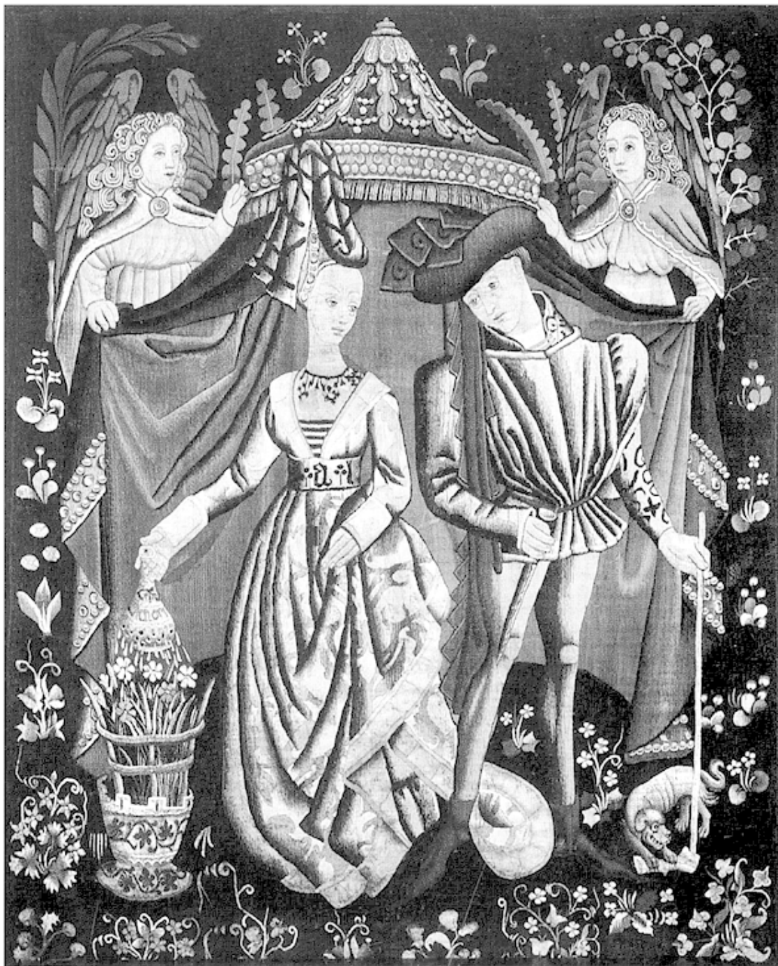
Шарль Орлеанский и Мария Клевская. На момент свадьбы жениху было 47 лет, а невесте едва исполнилось 14. Гобелен. Франция. XV в.

При этом даже в той же самой пьесе Шекспира есть и такой разговор: Капулетти: