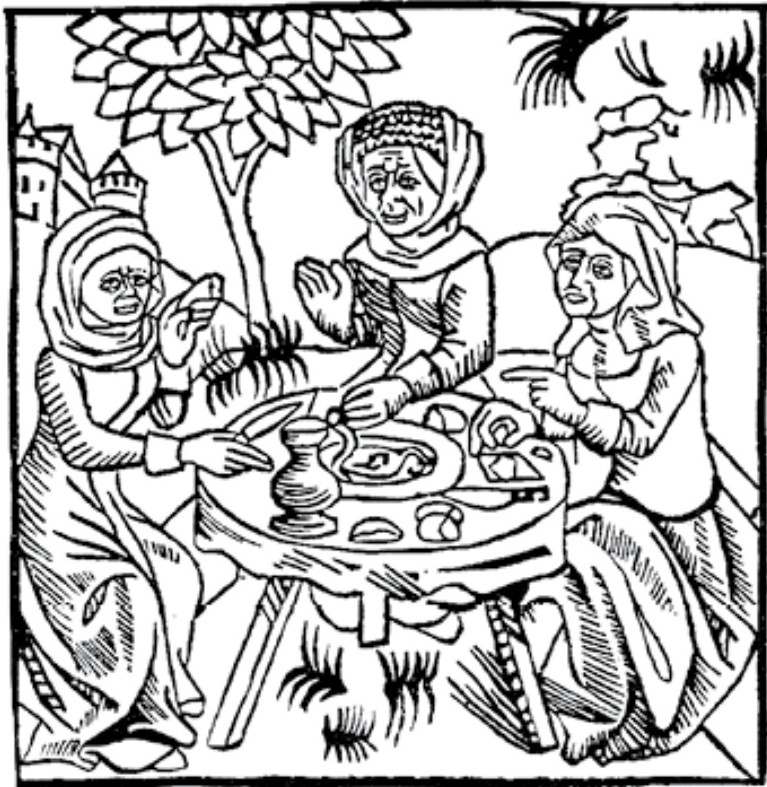
Обед. Гравюра конца XV – начала XVI в.

Есть в этом хоть доля правды? Откуда вообще взялись эти цифры? Не с потолка, как ни странно.