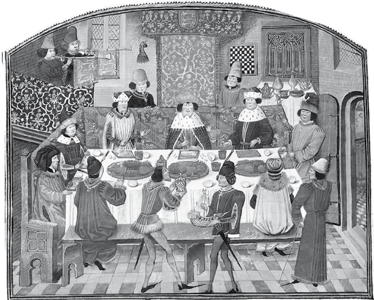
Королевская трапеза. Жан Фруассар. Хроники. Миниатюра XV в.

Для историка эта граница в 60 лет означает, что общество, ее установившее, признавало, что за ней начинается снижение способностей и упадок сил. То есть, пожалуй, именно этот возраст, 60, можно определить в качестве возраста, с которого средневековый человек начинал считать себя старым. Расцвет же сил признавался у людей от 30 до 60 лет, потому что возраст в 30 лет был ниж-