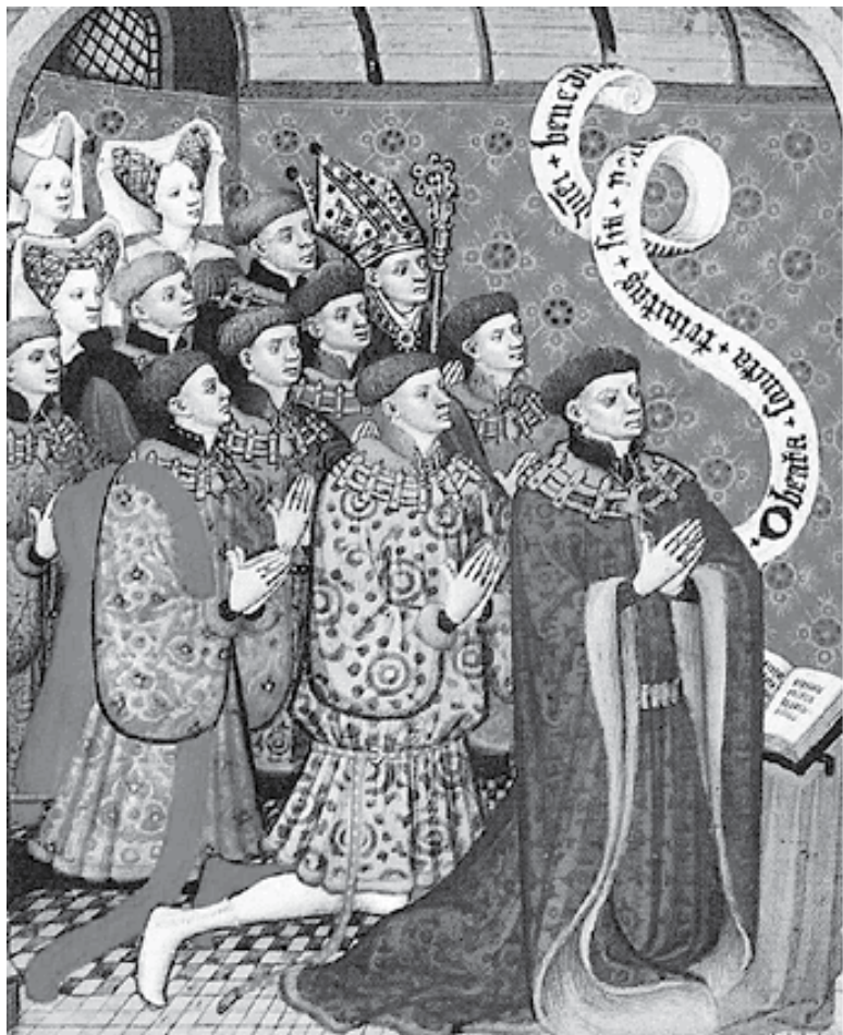
Ральф Невилл и его двенадцать детей. Миниатюра из книги «Livre d'heures de la famille Neville», Мюнхенский