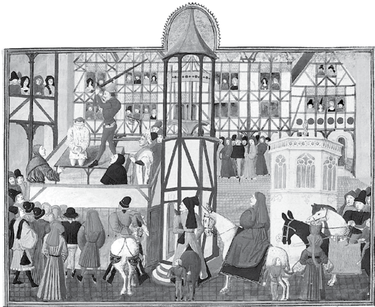
Публичная казнь. Жан Фруассар. Хроники. Миниатюра XV в.