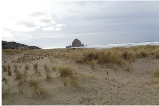
У подножия его величества великого Тихого океана. Штат Вашингтон