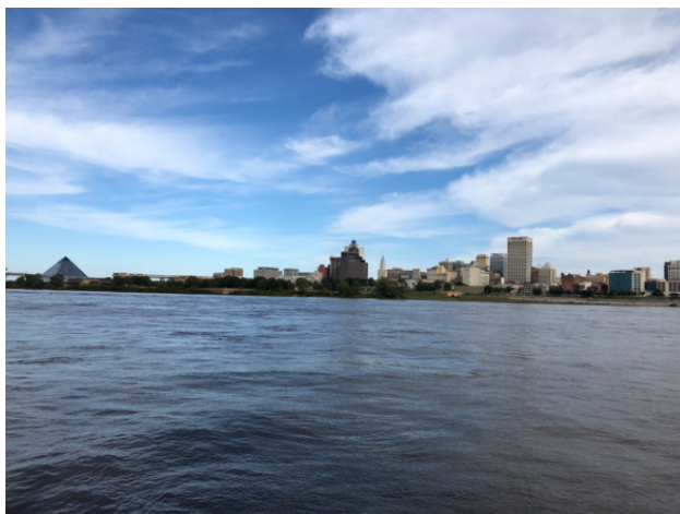
Вид на город Мемфис с правого берега реки Миссисипи. Даунтаун.