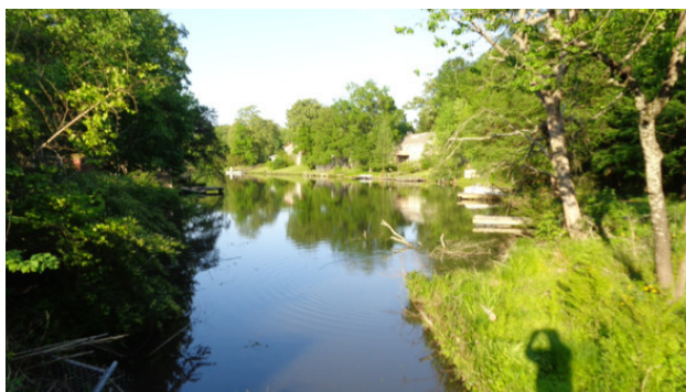
Живописные места для рыбалки