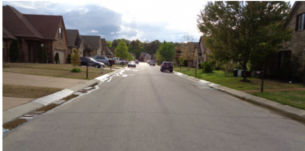
Жилой квартал города Кордова