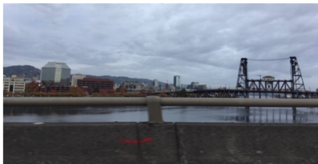
Через водные магистрали города Портленд