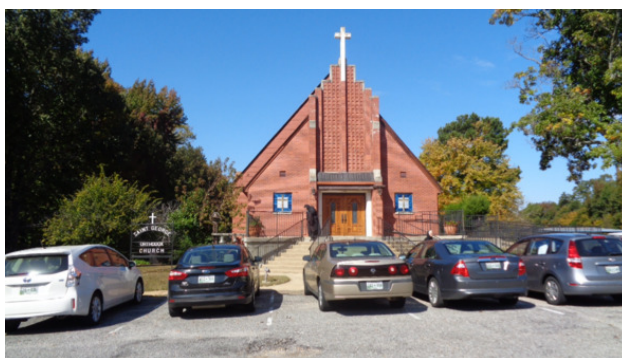
Православный Храм. Город Кордова