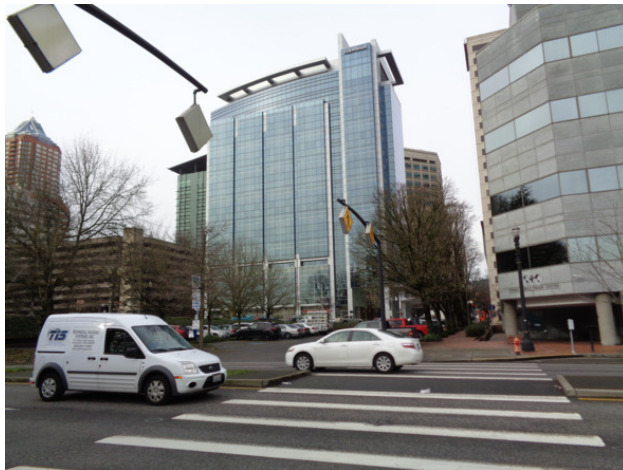
Уголок центральной части города Портленд (штат Орегон, США)