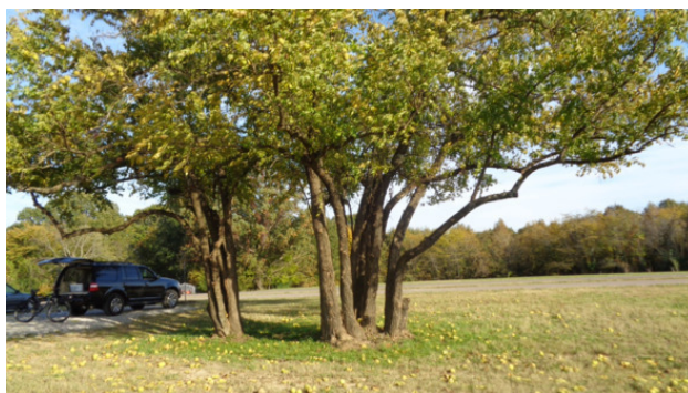
Адамово дерево и его плоды