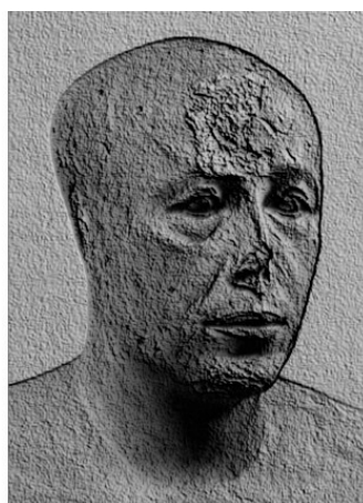
Рис.4 Портретный бюст царского сына Анххафа

интеллекта выше сознания древнего египтянина поздней эпохи – эпохи Саисского возрождения, например. Или представителя высшего сословия времён Древнего царства, опиравшегося на непрерывную многовековую жреческую традицию и на многолетнее личное совершенствование в образовании себя. Достаточно взглянуть на портретный бюст царского сына Анххафа, чтобы увидеть и почувствовать мощь интеллекта, которая светится в этом лице. Причём интеллекта, уже подёрнутого иронией. Много ли встретится таких лиц в современном учёном многолюдьё? Уровень обыденного сознания нашего времени примерно соответствует обыденному сознанию египтян эпохи Рамессидов, когда ржавчина эго быстро разъедала ткань общины. Единственное отличие в том, что сегодня это уровень сознания среднечеловеческий, тогда как в эпоху Рамессидов он был достигнут только лишь в тесных границах древнеегипетского сообщества.