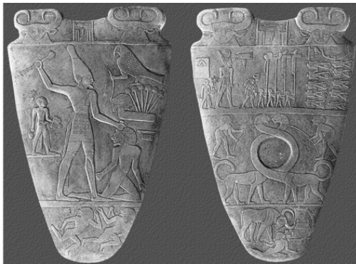
Рис.3 Палетка Нармера (см. примечание 2)

И действительно, Древнее царство – это время наивысших достижений египетского интеллекта, время гармонии и процветания. В эту эпоху был достигнут тот уровень духовности, выразившийся и в архитектуре, и в изобразительном искусстве, и в религиозном видении мира, который в последующие времена уже никогда не будет превзойдён. Всё то, что было создано после, – это взгляд в прошлое, попытка понять и высветить те вершины интеллекта, которые уже были достигнуты в период цветущего поиска, ещё не замутнённого пеленой устоявшихся представлений, не скованного жёсткими рамками тысячелетней традиции. Это попытка реконструкции и возврата в счастливую эпоху здоровья и пылкой энергии юности. Но действительный возврат в «золотые века» был невозможен. Ибо уже к концу эпохи Древне-