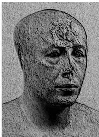
Рис.4 Портретный бюст царского сына Анххафа

вершенствование в образовании себя. Достаточно взглянуть на портретный бюст царского сына Анххафа, чтобы увидеть и почувствовать мощь интеллекта, которая светится в этом лице. Причём интеллекта, уже подёрнутого иронией. Много ли встретится таких лиц в современном учёном многолюдье? Уровень обыденного сознания нашего времени примерно соответствует обыденному сознанию египтян эпохи Рамессидов, когда ржавчина эго быстро разъедала ткань общины. Единственное отличие в том, что сегодня это уровень сознания среднечеловеческий, тогда как в эпоху Рамессидов он был достигнут только лишь в тесных границах древнеегипетского сообщества.